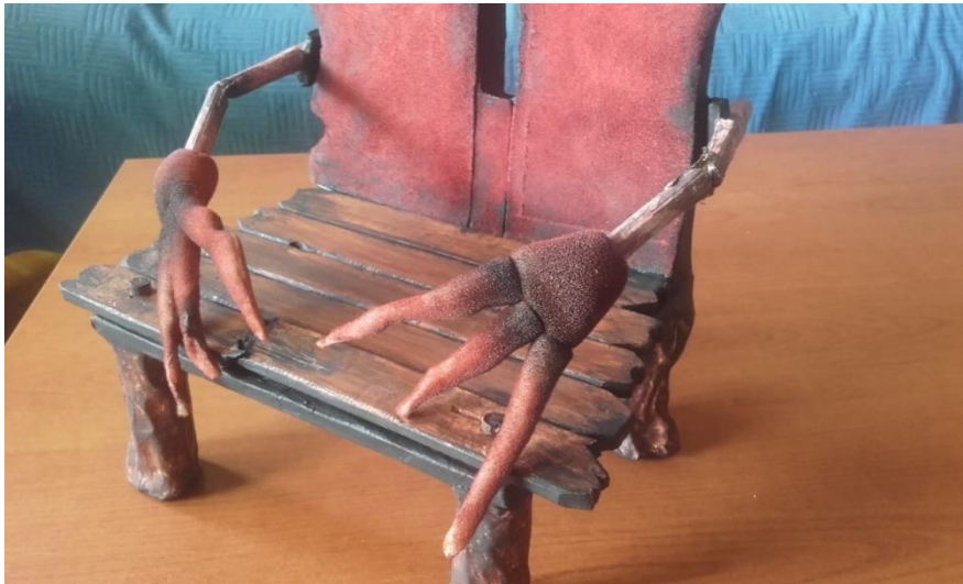
Slika VIII. Stolac s pokretnim rukama

Da bi se ruke mogle na praktičan način animirati stavila sam vodilice izrađene od tipla. Dodavanjem šarke i vodilice dobila sam na fleksibilnosti i pokretljivosti. Kad se rukohvat stolca animira imamo dojam živog lika koje može izraziti emociju, dohvaćati stvari, zarobiti Lovorku...Naslonjač je modeliran u stiroduru te je preko njega zalijepljena crvena brušena koža (Slika IX.).