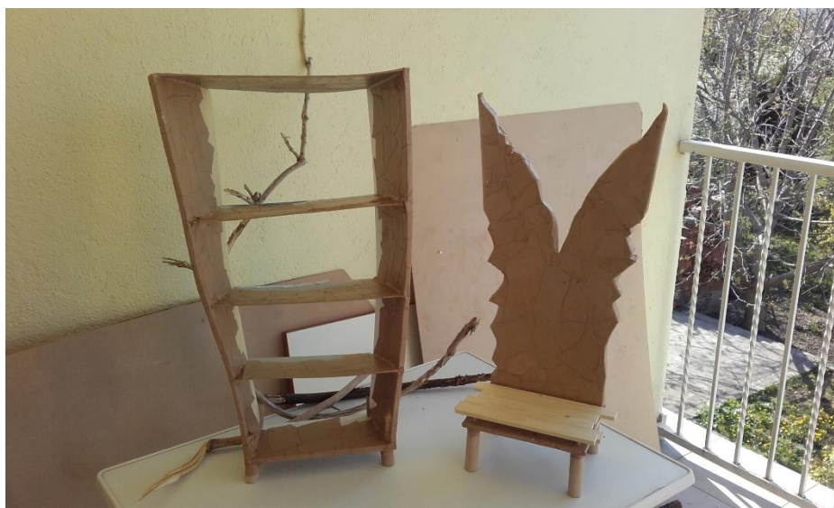
Slika III. Realizacija elemenata

Nakon što su skice odobrene krenulo je modeliranje i realizacija elemenata (Slika III.).