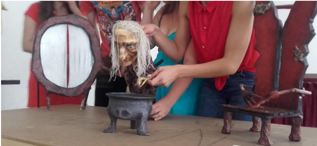
Slika VI. Unutrašnjost dvorca

Djevojčičina kuća: nježna seoksa kućica s jednim drvcem na sceni.