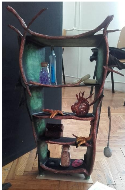
Slika V. Polica s napitcima

Unutrašnjost dvorca sastoji se od glomazne i velike police sa sastojcima za kuhanje napitaka (Slika V.). Važnost police i napitaka je u dočaravanju opasnosti vještichjeg dvorca. Stolackoji je ujedno i oživljava kao lik sa rukama, zarobi Lovorku. Kotao koji služi za kuhanje kreme i čarobnog zrcala u kojem gledamo igru sjena te kroz koje prolaze lutke u unutrašnjost dvorca. (Slika VI.).