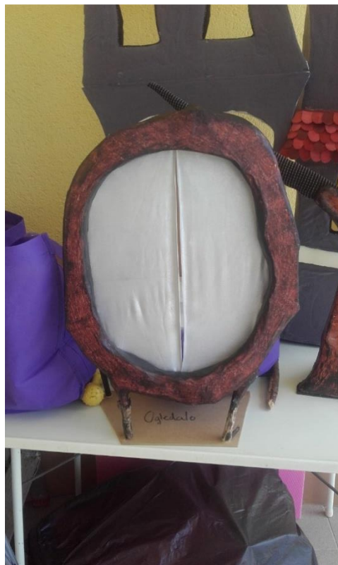
Slika XV. Zrcalo

Okvir zrcala koje se pojavljuje u unutrašnjosti dvorca modelirano je u stirodoru a zrcalnu površinu dočarala sam srebrnim platnom. Platno služi kao čaroban ulaz u dvorac kroz koja dolazi Lovorka, te za tehniku sjena kojom se prikazuje gubitak Zlogrbinog slomljenog srca (Slika XV.).