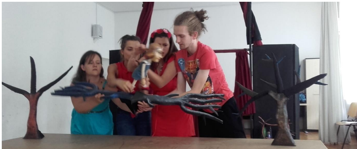
Slika XVII. Prikaz kretnje elemenata po zraku

Ovi elementi na sceni bili su potrebni kako bi se pokazala oživljenost i začaranost unutrašnjosti dvorca. Radi se o vještici koja se bavi magijom. U dramskom tekstu stoji da su elementi začarani i trebaju se kretati po zraku, plesati...(Slika XVII.).