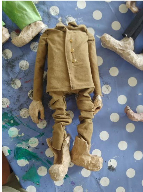
Slika XV. Spojeni djelovi lutke s kostimom

Nakon što sam izradio sve dijelove lutaka, krenuo sam izrađivati kostime za lutke. Sve dijelove mogao sam spojiti kada sam imao gotove kostime. Kada sam sašio kostime, prvo sam ugurao udove u rukave i u hlače, pa sam ih tako mogao spojiti s torzom. Iznimka je bio zatvorenik, jer je on imao najjednostavniji kostim.