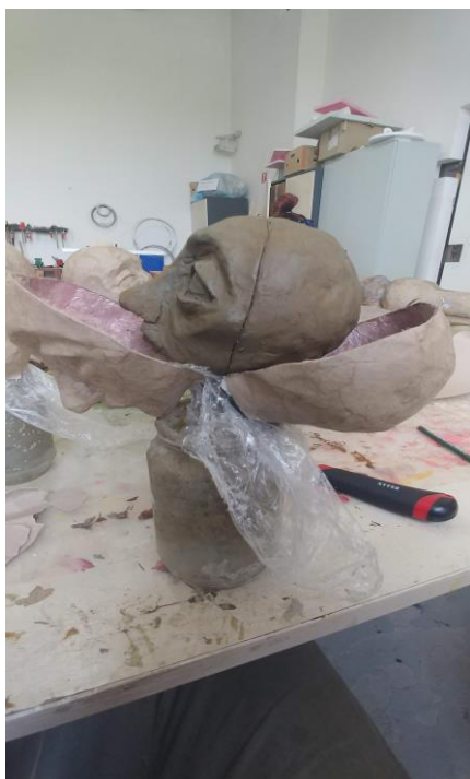
Slika X. Proces odvajanja kaširanog sloja od gline

Kada sam spojio i završio kaširane pozitive, mogao sam početi s oslikavanjem. Prvo sam morao nanijeti temeljnu boju - mješavinu fasadne boje i malo ljepila za drvo.