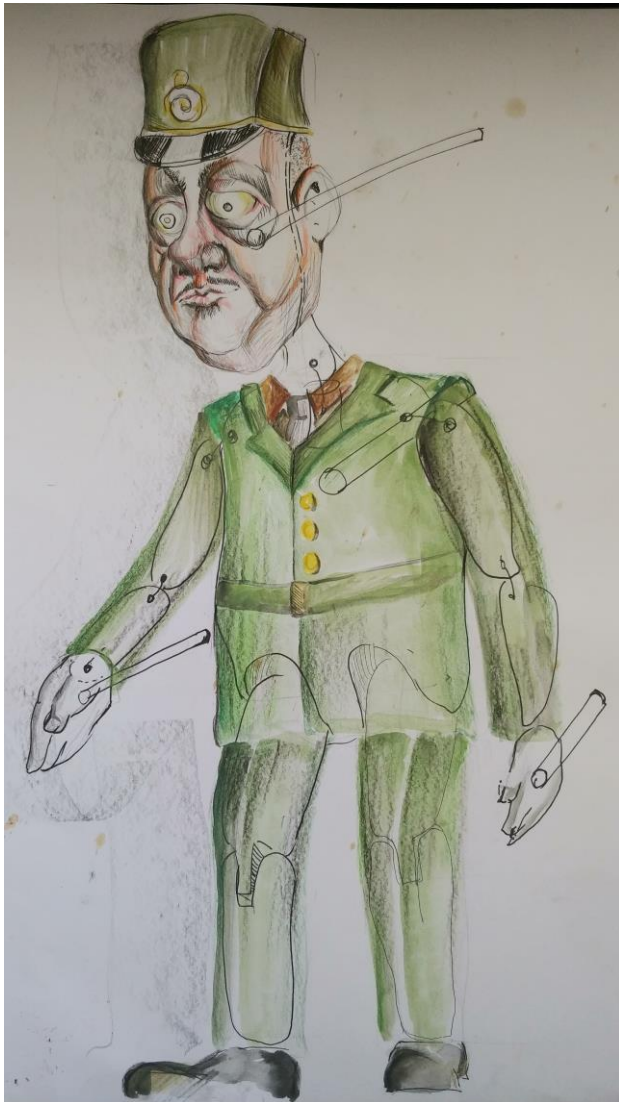
Slika V. Skica oficira

Nakon što sam odabirom boja i izrazom lica odredio sve karakere, slijedila je faza osmišljavanja kostima za sve likove. Za kostim sam također tražio inspiraciju u njemačkim feldmaršalima iz perioda Prvog svjetskog rata. Povijesne ličnosti imale su puno kompleksnije odore s puno detalja. U svojim skicama držao sam se pojednostavljene forme, kako bi se iz kroja i boje kostima lako moglo iščitati da lutka predstavlja visokog časnika.