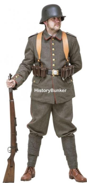
Slika VII. Nadahnuće s interneta 9

Najprije sam kompletirao sve likove koji su bili već u koloniji i očekivali putnikov dolazak. Na taj način sam si mogao zamisliti posebnu atmosferu koja je vladala između likova kolonije. To je također utjecalo na izgled njihovih karaktera. Inspiraciju za skicu vojnika sam također našao na dokumentiranim fotografijama Prvog svjetskog rata. Kostim čine crne vojničke čizme, koje sežu sve do koljena, te već navedena jednostavna vojnička odora i šljem.