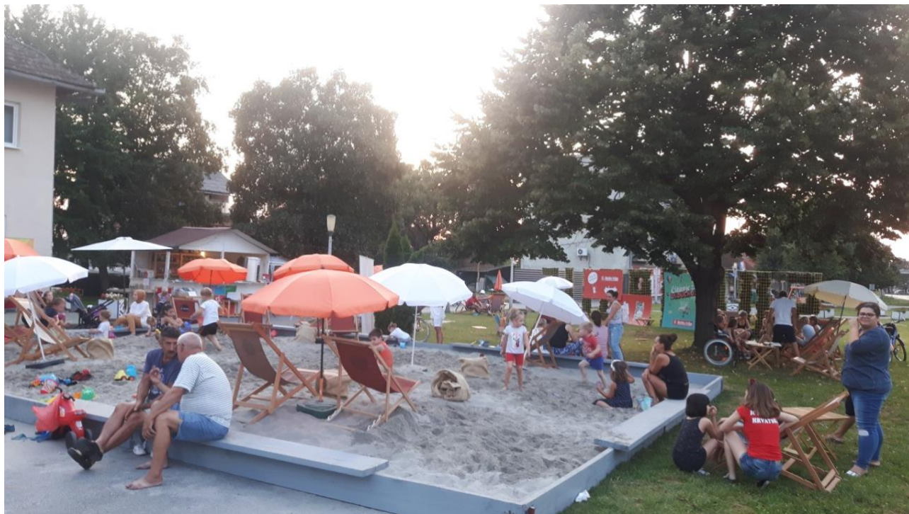
Slika 6: Suhopoljska KUL. plaža

Legenda o Andriji Jankoviću ispričana je tada kroz cijelu medijsku kampanju, na društvenim mrežama, web portalima, na lokalnoj radio postaji i televiziji. Privukla je velik broj posjetitelja, a zahvaljujući njima, Suhopoljska KUL. plaža danas, pet godina kasnije, postala je jedna od najposjećenijih ljetnih manifestacija u Virovitičko – podravskoj županiji, a osim lokalnih posjetitelja, privlači i turiste iz okolnih županija i susjednih država.