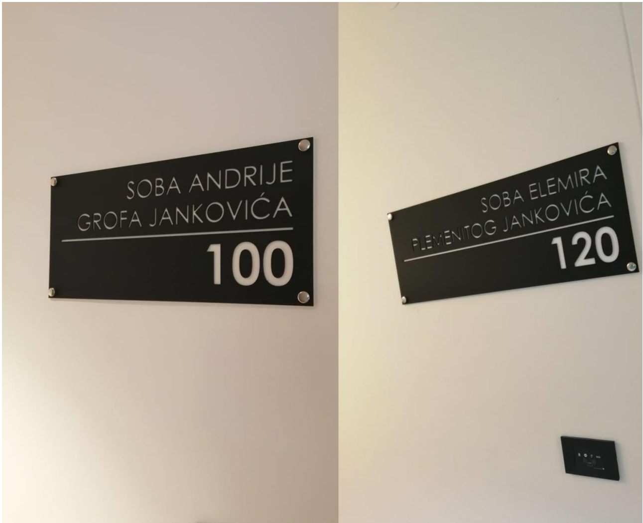
Slika 4: Ploče s nazivima soba u Centru za posjetitelje „Dvorac Janković“ u Suhopolju