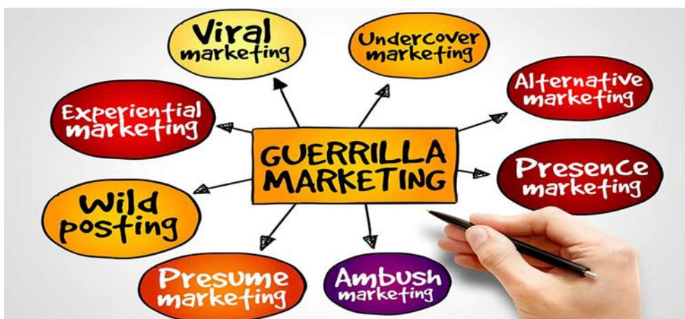
Slika 1: Oblici gerila oglašavanja