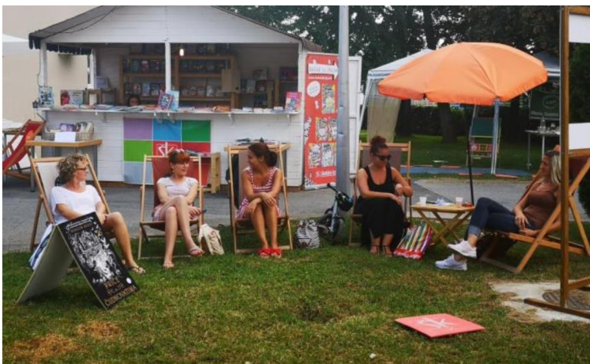
Od legende do Suhopoljske KUL. plaže

2016. godine, kada je ova manifestacija u Suhopolju organizirana po prvi puta, organizatori su posebnu pažnju pridali načinu oglašavanja i marketingu, kako bi se privukao što veći broj posjetitelja. Udruga, kao neprofitna organizacija, nerijetko se priklanja raznim nekonvencionalnim i financijski pristupačnim načinima oglašavanja koji iziskuju kreativnost i inovativnost, kako bi se istakli u masi. Isti se princip iskoristio i za Suhopoljsku KUL. plažu, čiji se marketing utemeljio na legendi o grofu Jankoviću, čiji je sin poželio imati plažu.