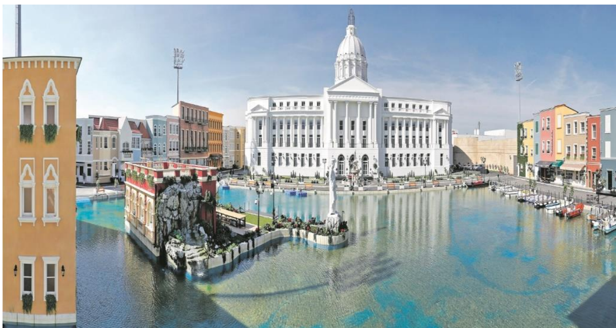
Slika 2. – Bijela kuća

koji se svake emisije izmjenjuju. Program od svojih početaka puni novinske stupce i obara rekorde gledanosti. U rujnu 2022. godine popularni influencer i YouTuber Bogdan Ilić, poznatiji kao Baka Prase, pokrenuo je peticiju za ukidanje Zadruga, zbog nesuglasica i međusobnog javnog serviranja prljavog rublja s vlasnikom televizije Pink. Do sada je emitirano pet sezona u sveukupnom trajanju od 1.514 dana; I. sezona 287 dana (6. rujna 2017. – 20. lipnja 2018.), II. Sezona 303 dana (6. rujna 2018. – 6. srpnja 2019.), III. Sezona 309 dana (6. rujna 2019. – 11. srpnja 2020.), IV. Sezona 307 dana 6. rujna 2020. – 10. srpnja 2021.) i V. sezona 308 dana (5. rujna 2021. – 10. srpnja 2022.).