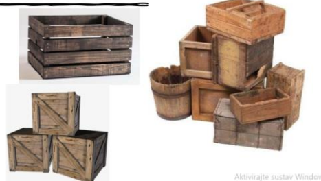
Slika IV. Slide iz powerpoint prezentacije o scenografiji