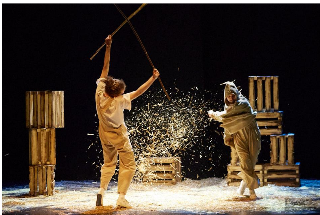
Slika XIII. fotografija s izvedbe predstave Bijeli klaun; Dječak i Zmaj