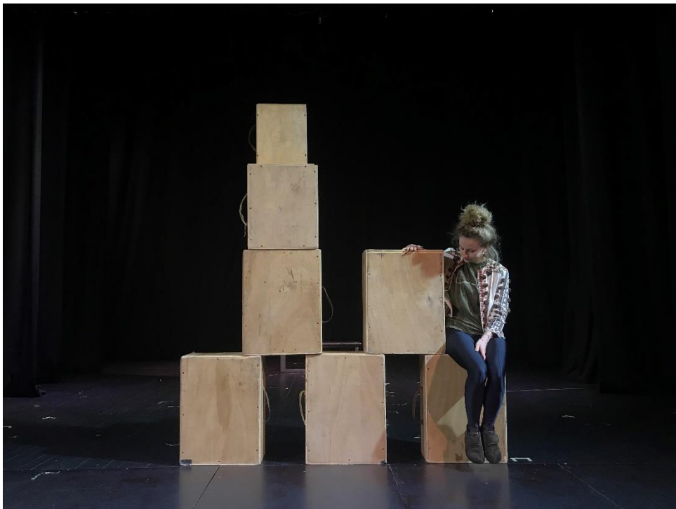
Slika VII. improvizacija s kutijama

Nadalje, na samom kraju predstave svaki lik u svojoj zadnjoj sceni uzima svoje dvije kutije (dva kofera) kada odlazi iz dječakovog života jer ti tereti i ti negativni osjećaji nisu njegovi i nisu dio njegove drugačijosti , već mu ih je nametnulo društvo. Njegov prostor je čist, prepun slame (pozitive), očišćen od teških kutija i negativnih konotacija vezanih uz njegovu drugačijost .