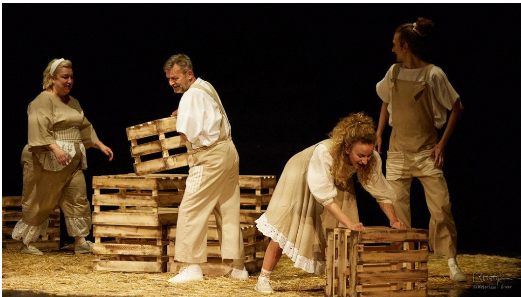
Slika XI. fotografija s izvedbe predstave Bijeli klaun; Mama, Tata, Gita i Dječak

svijeta, kao što se to događalo Dječaku, unutar toga važno je pronaći snagu. Upravo s kutijama pokušala sam dočarati koliko zastrašujuće i teško to može biti, a slama je služila kao taj trenutak prihvaćanja svoje drugáčijosti i koliko to može zapravo biti lijepo. Shvatila sam ljepotu drugáčijosti , ljepotu jedinstvenosti i da jedino iz nje kao takve možemo iskreno stvarati i raditi. Iako kroz proces u nekim trenucima nisam bila sigurna što dalje, nisam znala što raditi, bila sam iskrena prema glumcima te smo zajedno došli do rješenja. Osim prihvaćanja vlastite jedinstvenosti i drugáčijosti shvatila sam važnost timskog rada, shvatila sam koliko jedno ide uz drugo, a isto tako i to da se međusobno ne umanjuju. Iako trebamo težiti prihvaćanju i spoznaji vlastite drugáčijosti , vlastite individualnosti, jer nas čini jedinstvenima, kroz ovaj proces shvatila sam da ona poprima posebnu nijansu kada se ujedini s tuđim drugáčijostima . Iako Dječak na samom kraju predstave ostaje sam sa sobom i na takav način spoznaje svoju drugáčijost , jedinstvenost, boju, ja na kraju procesa za razliku od njega nisam ostala sama, već sam obogatila svoju paletu boja upravo nijansama ljudi s kojima sam radila.