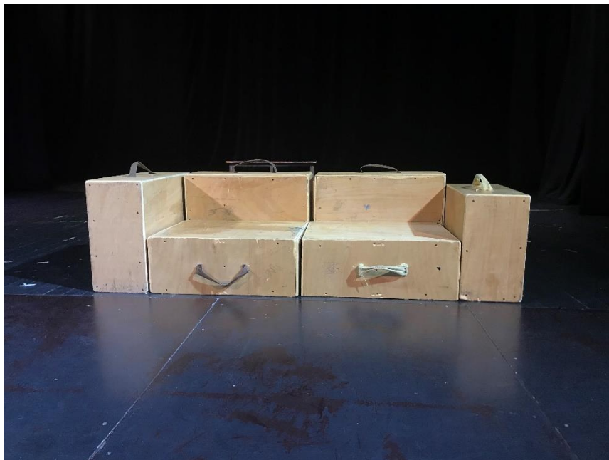
Slika IX. improvizacija s kutijama