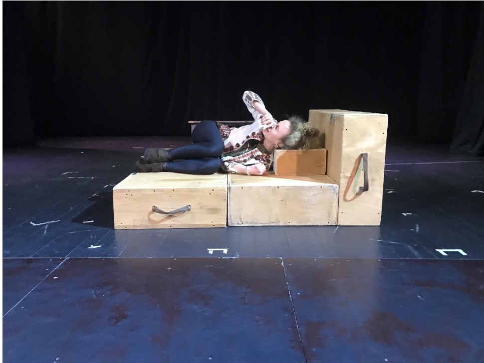
Slika VIII. improvizacija s kutijama