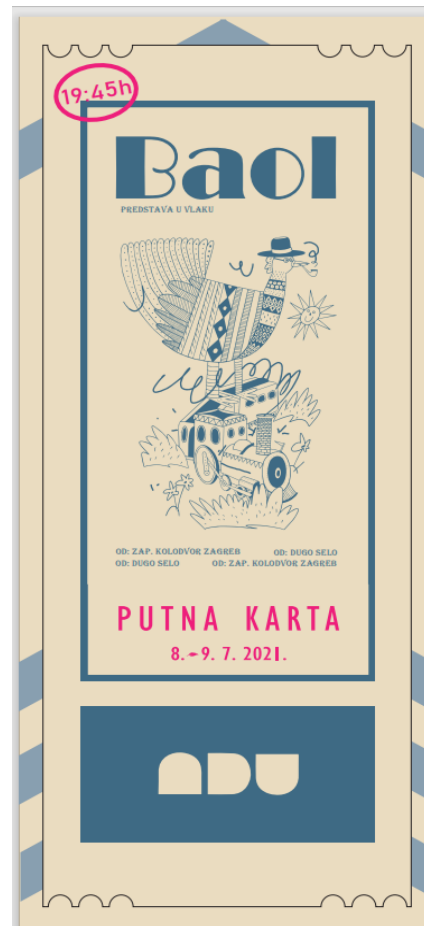
Slika 2: Karta za predstavu

Iako smo predstavu osmišljavali zajedno, projekt je inicijalno osmislila kolegica Katarina Krešić. Baol joj je bio završni ispit produkcije na trećoj godini na Akademiji dramske umjetnosti u Zagrebu. Maštala je o Baolu koji svoje pustolovine doživljava u Hrvatskoj, u vlaku za Dugo Selo. Poslala je pismo Hrvatskim željeznicama: „Baol. je autorski izvedbeni projekt koji će se izvoditi u putničkom vlaku, za redovne putnike u prigradskom prijevozu. Ovdje će se na relaciji Zapadni kolodvor (Zagreb) – Dugo Selo – Glavni kolodvor (Zagreb). Projekt je motiviran romanom Baol. Mirna noć režimska autora Stefano Bennija, a razvija se autorskim i izvođačkim timom sa željom istraživanja vlastitog izričaja u komunikaciji sa specifičnom publikom.