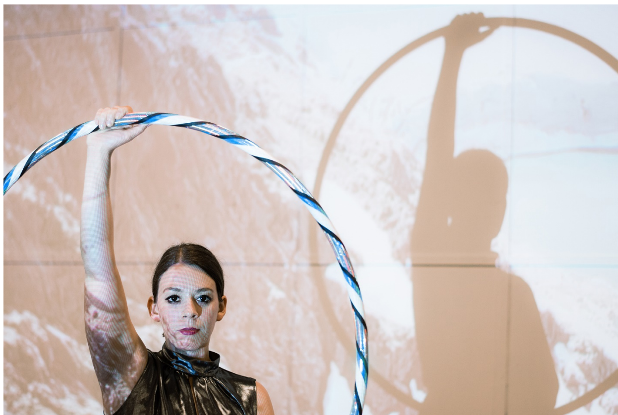
Prilog 4. Fotografija s izvedbe, POGON-Zagrebački centar za nezavisnu kulturu i mlade, foto: Matej Čelar

Možda se u trenutku pada, odnosno gubljenja kontrole nad vlastitim stvaralačkim procesom, otvara međuprostor koji nastaje u trenutku rascijepa, razdruživanja ega i onog. U izvedbi me zanima potencijal tog trenutka gdje možda zaista „postajem” polarni medvjed?