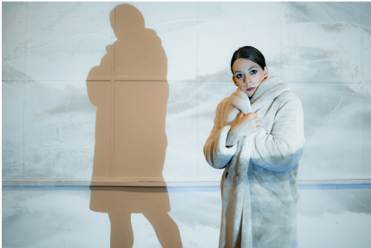
Prilog 1. Fotografija s izvedbe, POGON-Zagrebački centar za nezavisnu kulturu i mlade