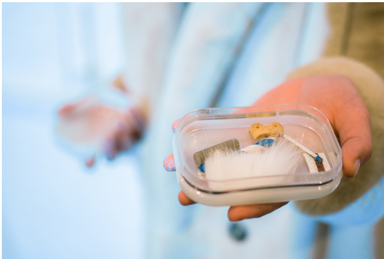
Prilog 2. Kutijica za preživljavanje nelagode prilikom susreta licem u lice s polarnim medvjedom inspirirana umjetničkim pravcem Fluxus