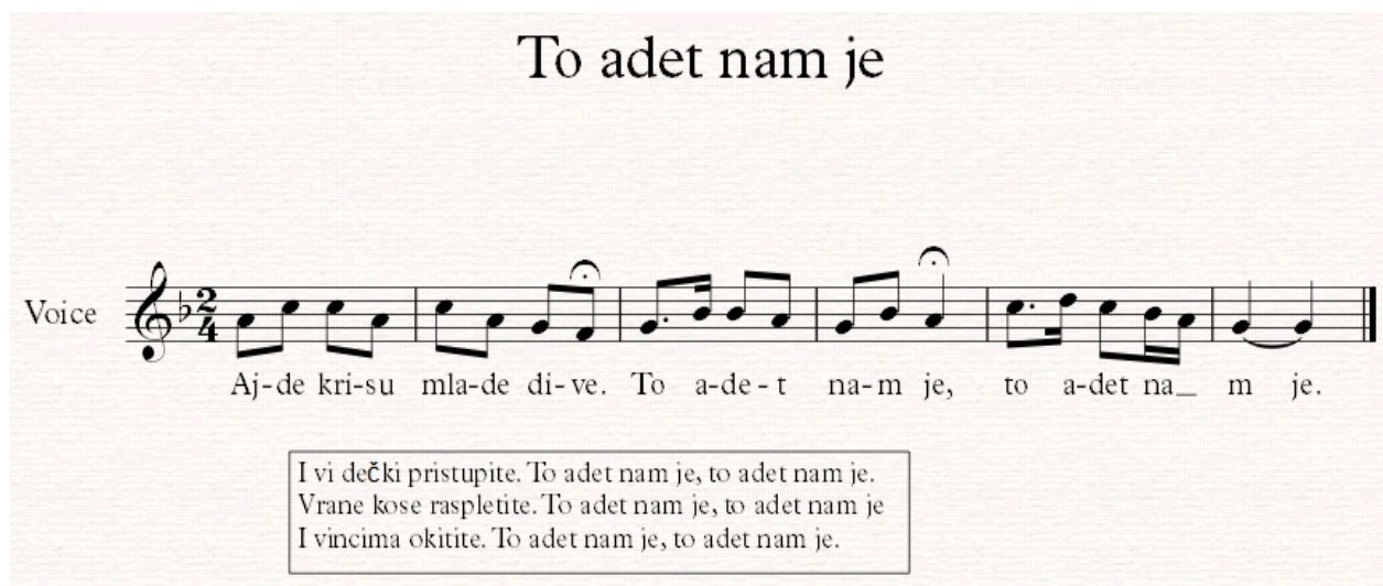
Notografija 10: napjev To adet nam je

Zatim se svi skupljaju oko vatre te počinje obredna pjesma To adet nam je :