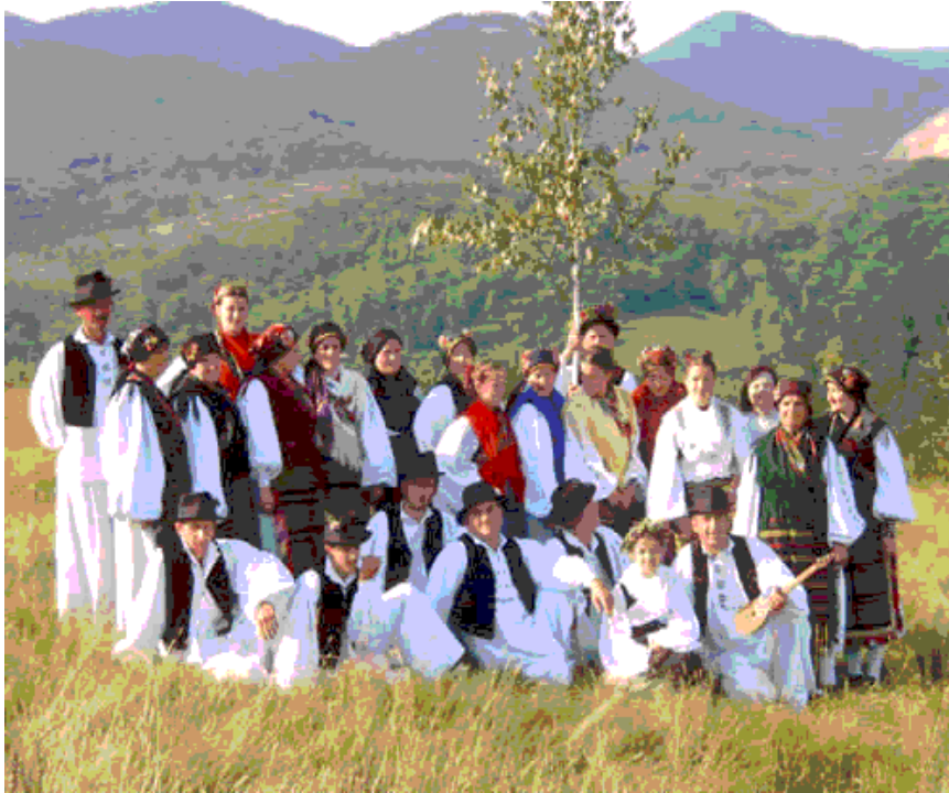
Slika 3: Na snimanju u Starim Potočanima

Na Spasovo, dok čobani čuvaju svoja stada goveda, svinja i ovaca, obrađuju drvo u obliku križa. Djevojke i snaše dolaze na ledine te nose cvijeće i primjerke najljepše nošnje kako bi okitili spasovsko druvo, dok prilaze ledini pjevaju pjesmu Spasovo je i lipo je vrime :