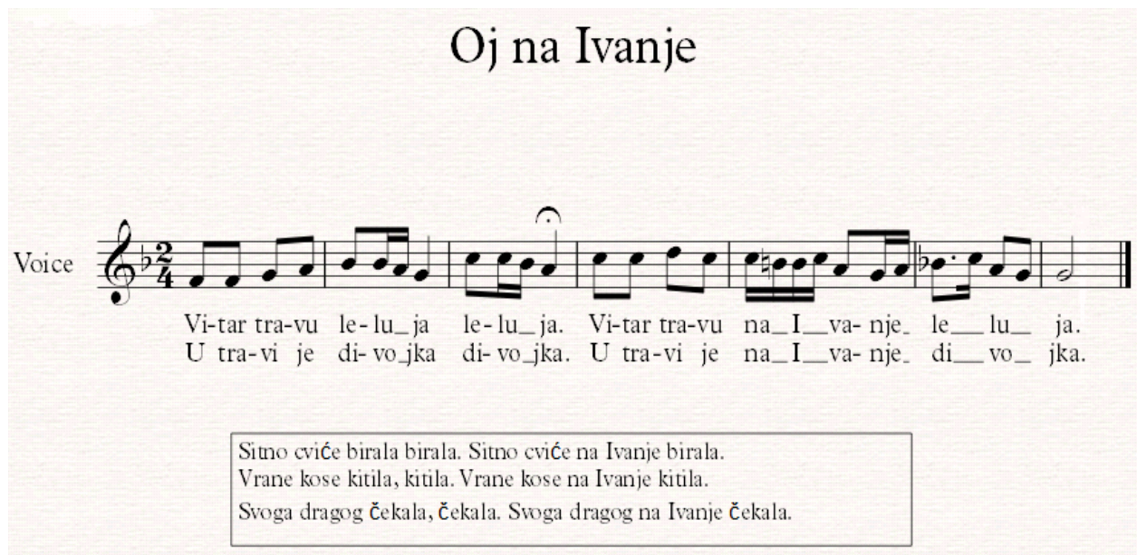
Notografija 9: napjev Oj na Ivanje

Muškarci su na obližnjem brdu podno Papuka zapalili vatru ( Ivanjski krijes ) od suhog drveta već prije svetkovine sv. Ivana Krstitelja. Iz sela se čuje pjesma djevojaka i snaša koje se penju prema krijesu. Djevojke su bose, rspletene kose te okićene vijencima livadnog cvijeća, a pjevaju pjesmu Oj na Ivanje :