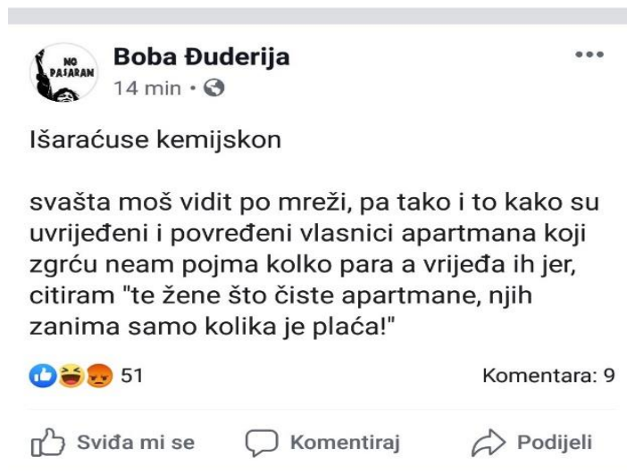
Slika 1: Humor Bobe Đuderije