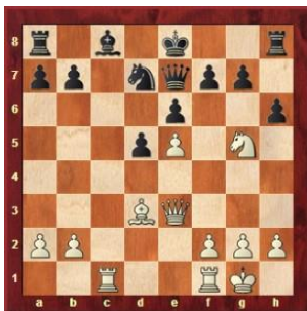
Slika 7. Primjer igre Magnusa Carlsena s 11 godina (već je tada postizao vrhunske rezultate u šahu, odigrao je remi s G. Kasparovom)

U suvremenoj pedagogiji aktivnost igre smatra se neizostavnom za potpunije ostvarenje odgojno obrazovnih ciljeva. Igram se djeci pomaže lakše razumjeti određeni nastavni sadržaj, potiče ih se na veću aktivnost i lakše uključivanje u nastavne zadatke. Igru djeca doživljavaju spontano i rado se u nju uključuju pa se i bolje motiviraju za nastavu. Učitelj neprestanim mijenjanjem sadržaja rada omogućava djeci aktivnije spoznavanje sebe i okoline.