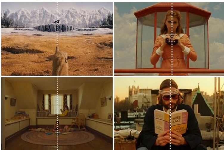
Slika 5: Simetrične scene u Andersonovim filmovima

Simetričnost kadrova možda je najprepoznatljivija vizualna značajka svih Andersonovih filmova. Andersonova duboko ukorijenjena ljubav prema simetriji i geometričnosti vidljiva je u gotovo svakom kadru, a od prvog njegovog filma sve se više oblikovala, sazrijevala i dolazila do izražaja. Tako se, promatrajući Andersonov rad, može zaključiti da je ova značajka danas procvjetala u punoj snazi. Čini se da Anderson ne može odoljeti privlačnosti recipročnog rasporeda rekvizita i likova ispred kamere. U filmovima Bottle Rocket i Rushmore postoji tek nekolicina primjera, no s obitelji Tenenbaum nadalje, gotovo svaki kadar postaje reprezentativan primjer simetričnosti. U kombinaciji sa svim ostalim vizualnim elementima, ova značajka postaje neizbježna u Andersonovom opusu. Kogonada, suradnik na britanskom filmskom institutu i filmski redatelj, napravio je video u kojemu je jasno pojašnjena ova simetričnost. U videu, Kogonada je postavio centriranu bijelu liniju preko brojnih kadrova iz Andersonovih filmova. Treba istaknuti da je velik utjecaj na Andersona imao Stanley Kubrick, redatelj također poznat po svojim savršeno simetričnim kadrovima.