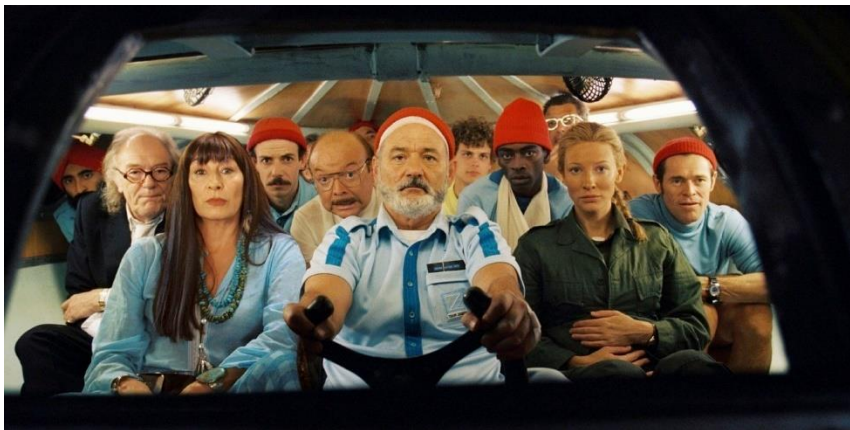
Slika 3: Simbolika crvene boje u filmu The Life Aquatic with Steve Zissou

boju, kao da se time želi asocirati na određenu dominaciju. Prema Vreelandu, u filmu The Life Aquatic with Steve Zissou , u sceni kada su svi okupljeni oko Zissoua dok upravlja podmornicom, svi muški likovi nose crvene kape. U ovom slučaju, crvena boja predstavlja nadilaženje Zissouovih nesigurnosti oko snimanja filma. U filmu The Darjeeling Limited , imamo scenu pogreba oca trojice sinova, a očev crveni automobil jedini je objekt koji povezuje oca i sinove. Chas Tenenbaum nosi jednaku crvenu Adidas trenerku kao njegovi sinovi, Ari i Uzi. Obilježje Andersona kao redatelja jest da više nego većina drugih redatelja koristi kostime i boje kao ekstenzije osobnosti njegovih likova.