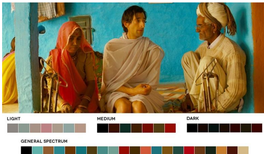
Slika 1: Paleta boja u filmu The Darjeeling Limited