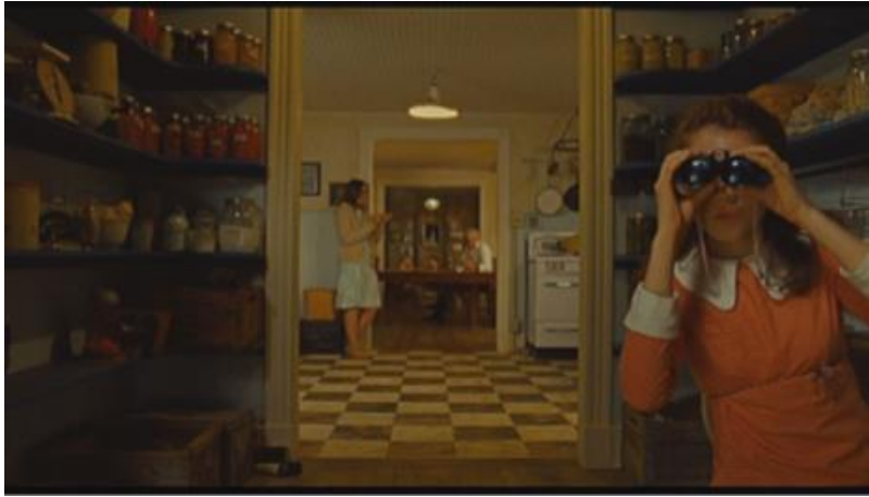
Slika 7: Scena iz filma Moonrise Kingdom

organiziran, iznimno pažljivo kalkularan, a specifične informacije koje se otkrivaju tijekom tih kadrova predstavljaju prvi korak u kojemu gledatelji mogu suosjećati s protagonistima.