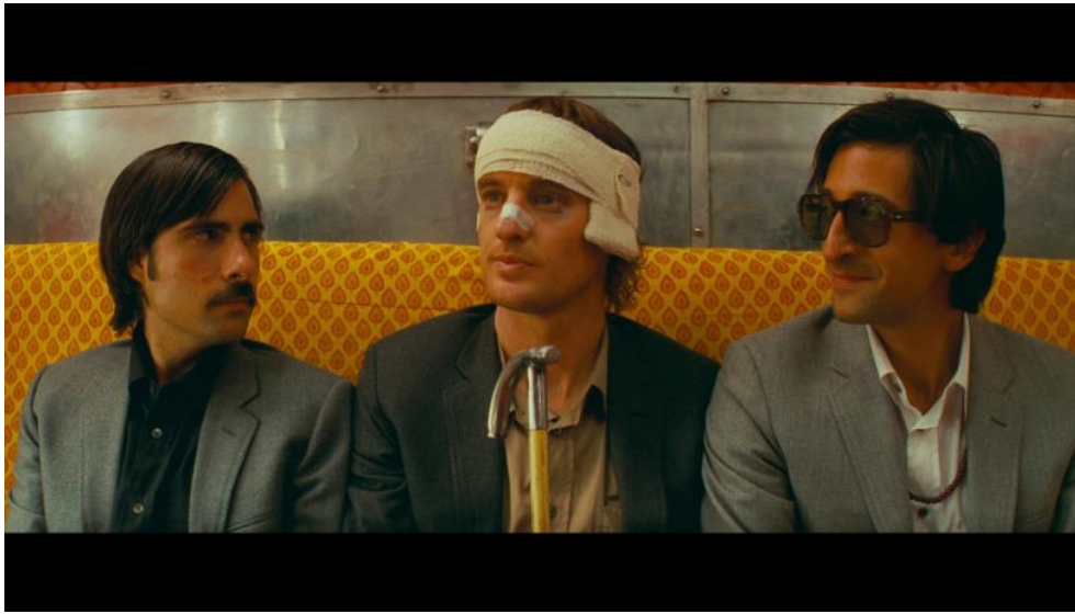
Slika 8: Blizi kadar u filmu The Darjeeling Limited

U ovom filmu koriste se blizi kadrovi kako bi prikazali lica glavnih likova, braće Francisa, Petera i Jacka, koji sjede jedan do drugoga ispred kamere. Sličnu scenu imamo u trenutku sprovođa indijskog dječaka koji se utopio u rijeci. U toj sceni, stanovnici sela i trojica braće stoje mirno, nema glazbe niti dijaloga, a likovi su poredani pravilno. Blizi kadrovi u ovoj sceni navode gledatelje da se fokusiraju na trenutak.