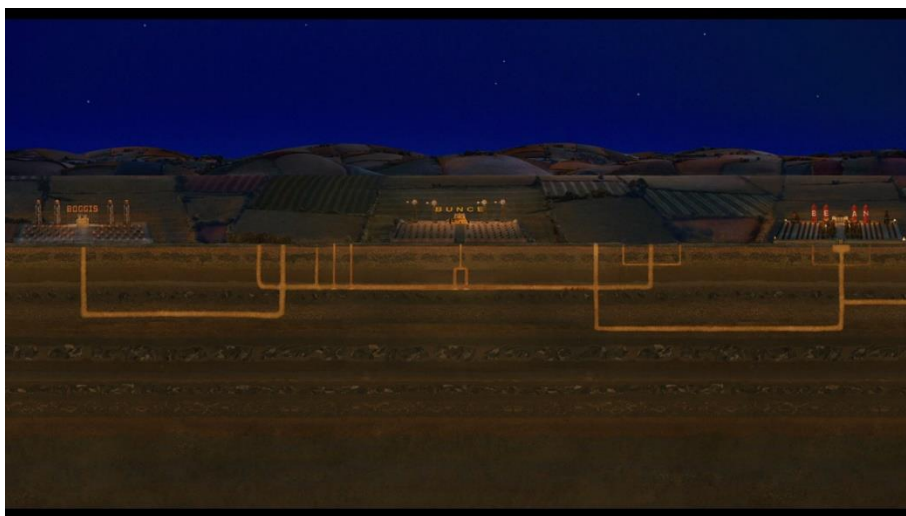
Slika 6: Bočni kadar u filmu Fantastic Mr Fox

U ovom filmu postoji nekoliko zanimljivih bočnih kadrova. Prvi takav možemo vidjeti u dijelu filma kada lisice počnu kopati rovove u zemlji, a likovi i rovovi prikazani su s bočne strane, tako da je unutrašnjost zemlje doslovno prerezana kako bi vidjeli gdje se likovi kreću. Također, u kasnijoj sceni koja prikazuje poplavu, likove na isti način pratimo dok ih jabukovača nosi kroz cijevi. Sličnosti s ovim scenama možemo pronaći s već spomenutom scenom makete broda Belafontea u filmu The Life Aquatic with Steve Zissou , koja je također prerezana napola kako bi gledatelji vidjeli unutrašnjost svake prostorije.