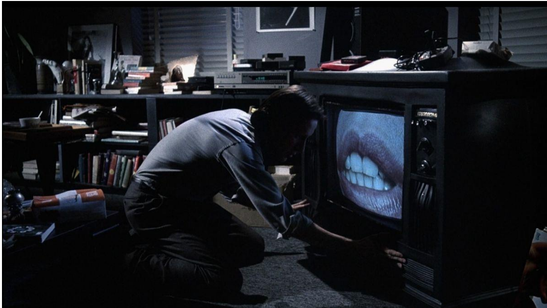
Slika 6. Videodrome