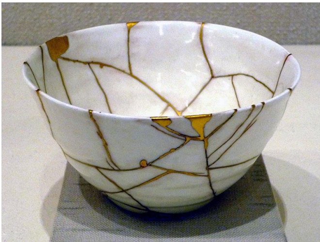
Slika 2. Kintusgi-umjetnost popravljanja posuđa sa zlatom