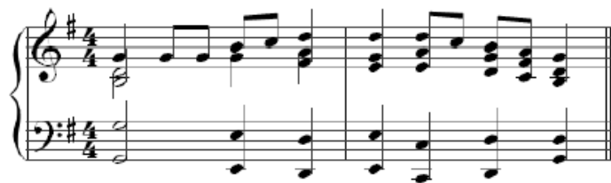
Slika 2: Zadatak iz druge serije

Zadatke za regionalni sluh osmislio je na način da se ispitaniku zadaje jedan ton na klaviru, a on ga mora pronaći.