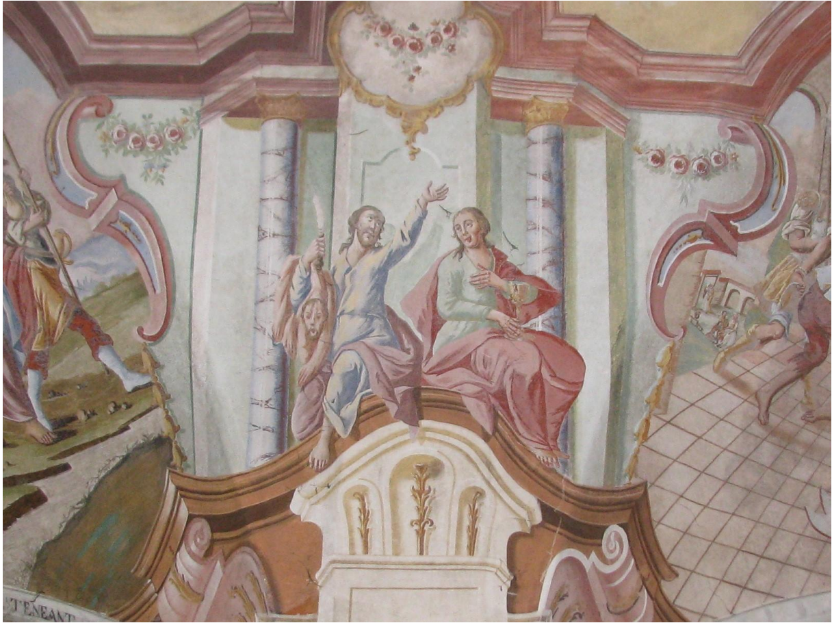
Prilog 16. Obodom svoda nanizani su apostoli prepoznatljivi po atributima. Ivan drži u ruci kalež, a Bartolu je preko ramena ovješena njegova koža.