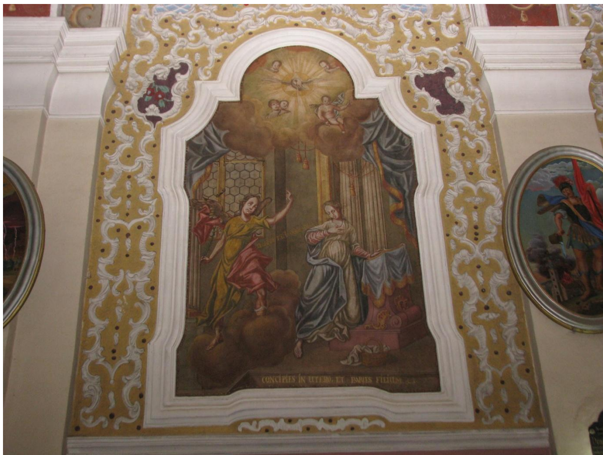
Prilog 10. Marijino navještenje