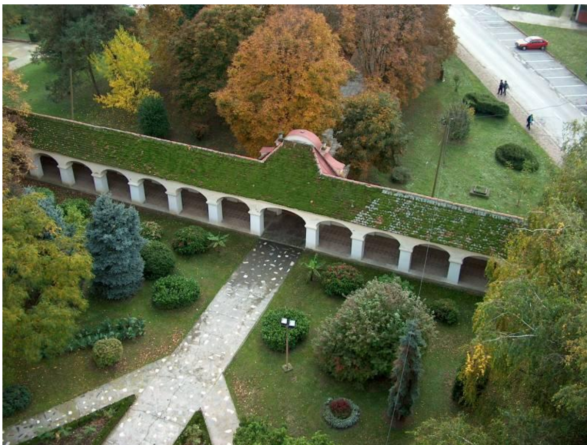
Prilog 3. Pogled na dvorište i ograđeni dio oko hodočasničke crkve, južna strana - cinktor.