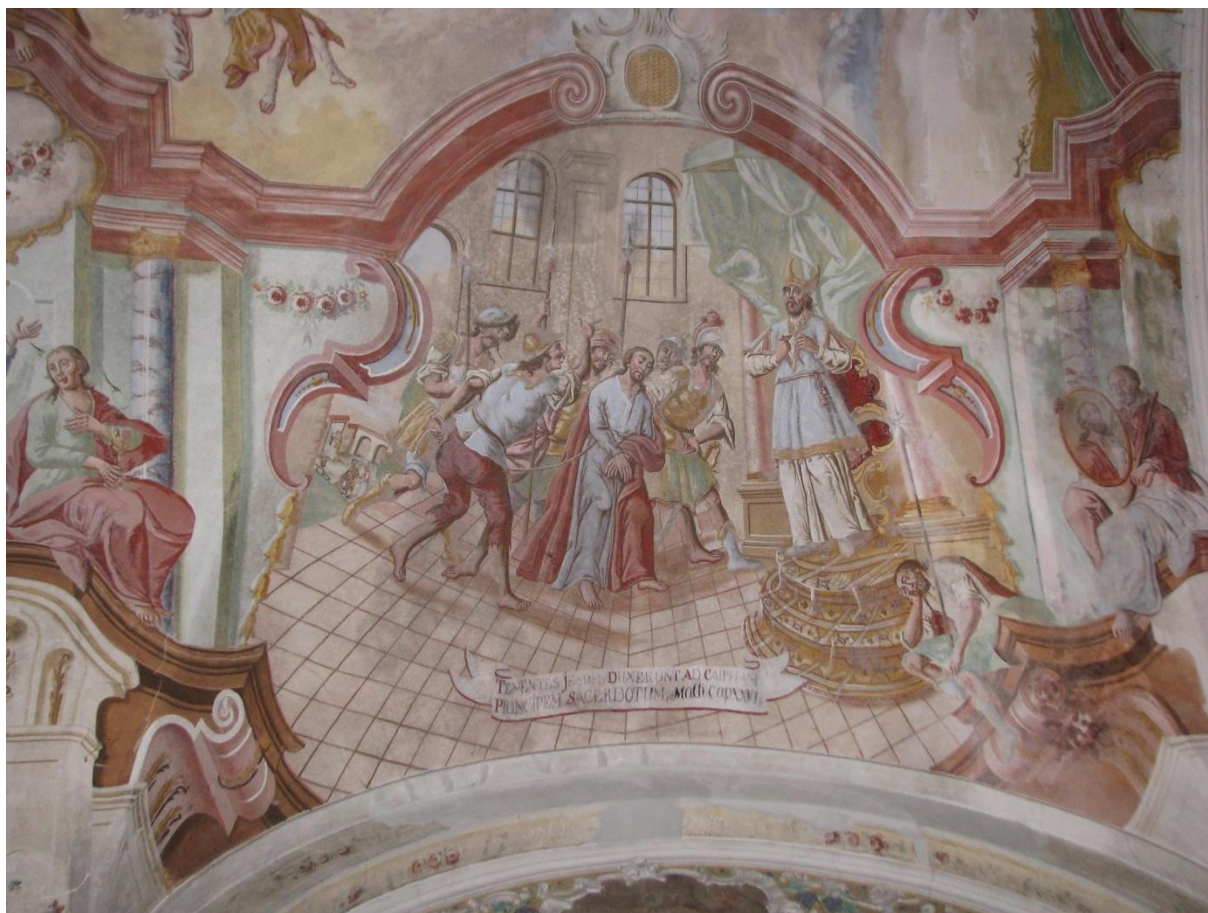
Prilog 11. Krist pred Kajfom