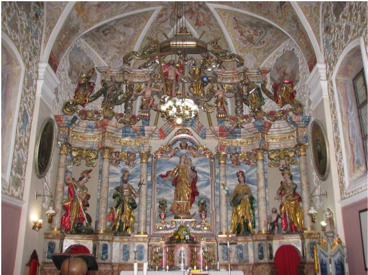
Prilog 18. Pogled na oltar