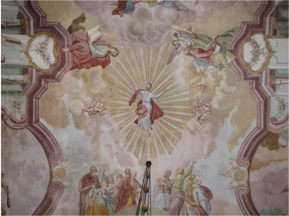
Prilog 14. Uznesenje