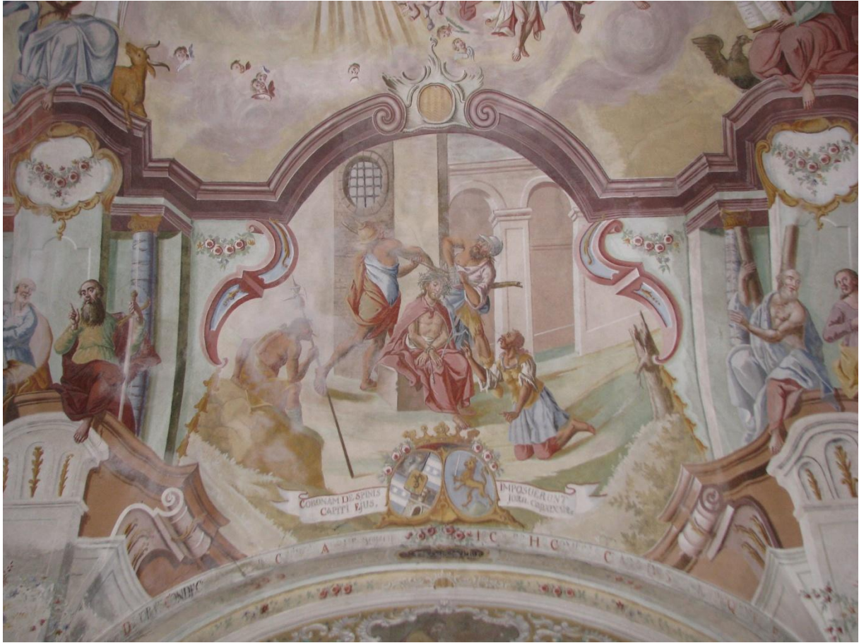
Prilog 12. Krunjenje Isusa trnovom krunom