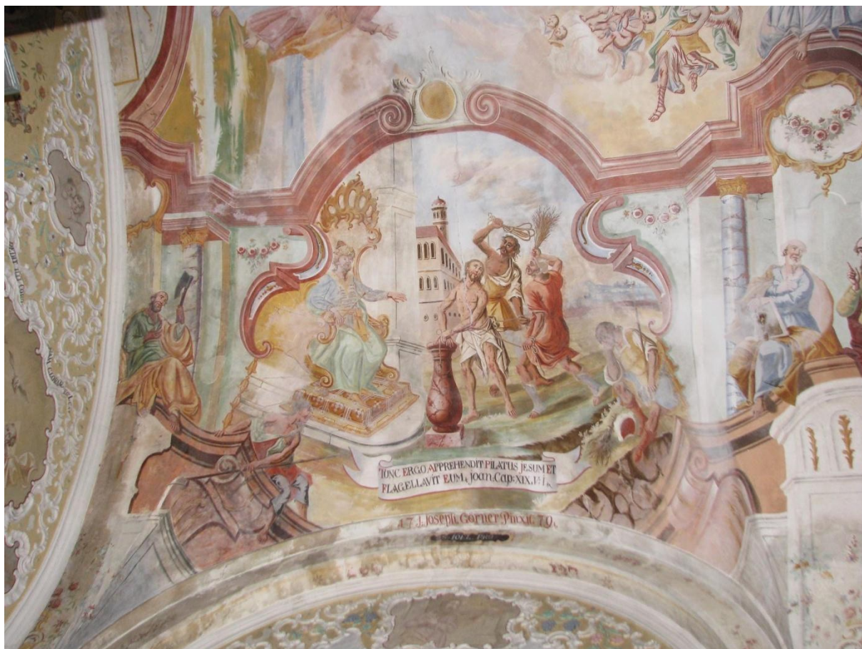
Prilog 17. Ilustracija pasionskoga motiva „Tada Pilat uze i izbičeva Isusa“. Ispod prizora signatura slikara J. J. Görnera iz godine 1779.