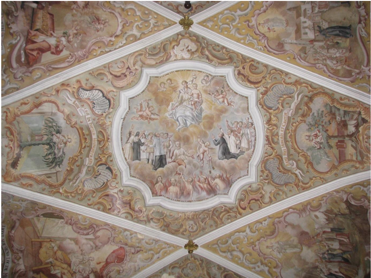
Prilog 8. Svod svetišta s legendom o Mariji Snježnoj. Djevica Marija upućuje škapular okupljenim vjernicima i dušama u čistilištu - središnji medaljon na svodu svetišta