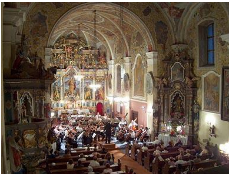
Prilog 5. Pogled na crkvenu lađu i svetište. Preuzeto iz: http://www.najboljeuhrvatskoj.info/ideje/crkva-sv-marije-snjezne-kutina-3574.html (datum pristupanja internetskoj stranici - 26. 8. 2017.)