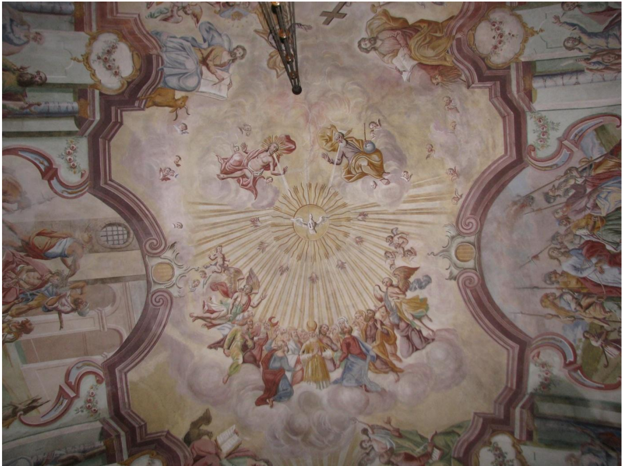
Prilog 9. Oslikani svod nad crkvenim brodom s prikazima Kristove muke i slave