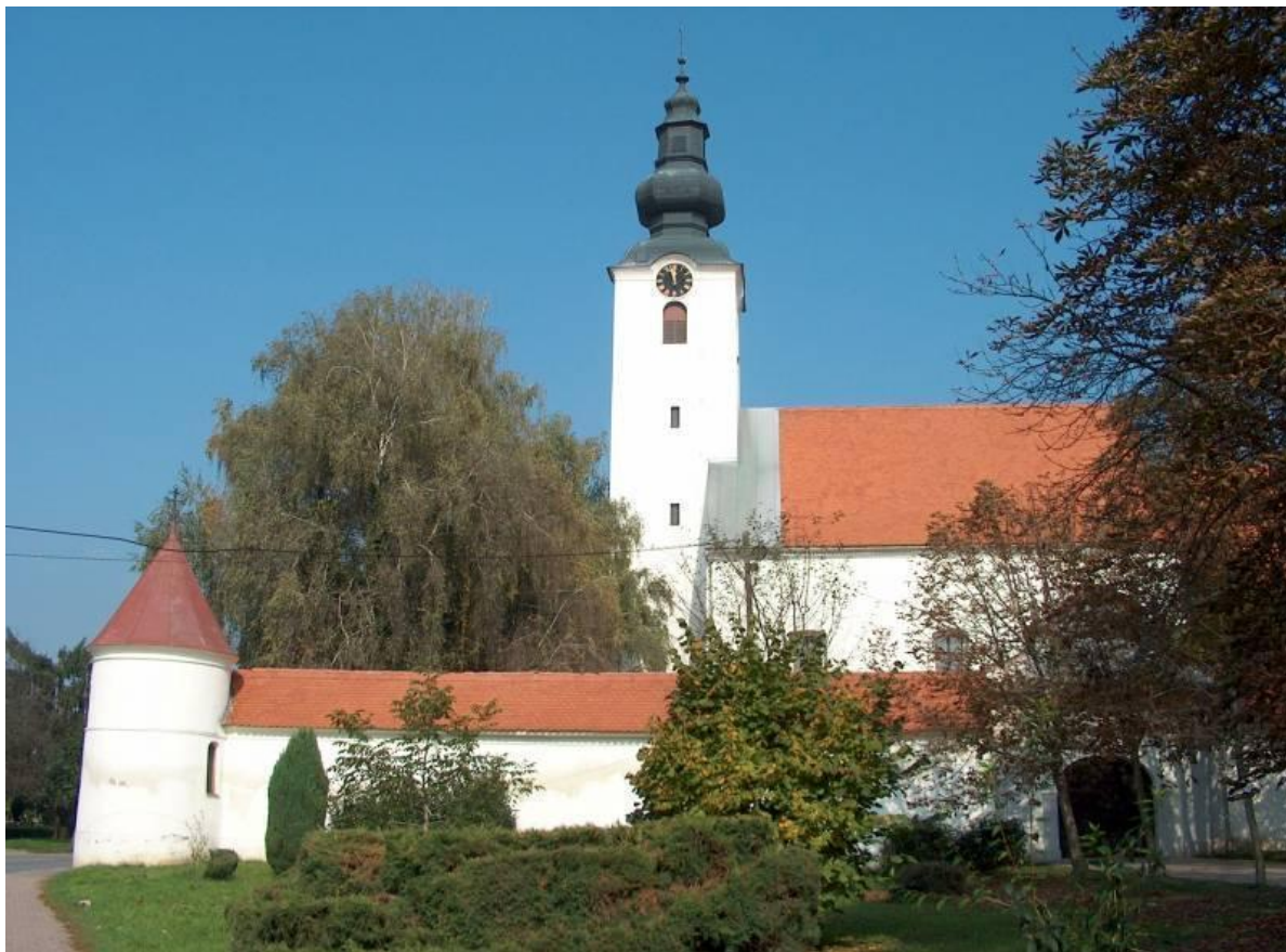
Prilog 2. Pogled na eksterijer crkve. Preuzeto iz: http://www.kutinaplaces.com/lokacije/posjetite/crkva-sv-marije-snezne (datum pristupanja internetskoj stranici - 21. 8. 2017.)