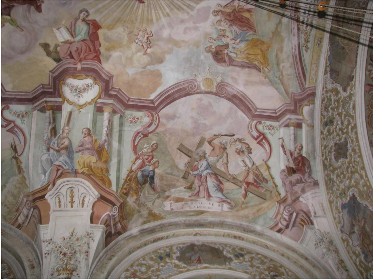
Prilog 13. Isus nosi križ