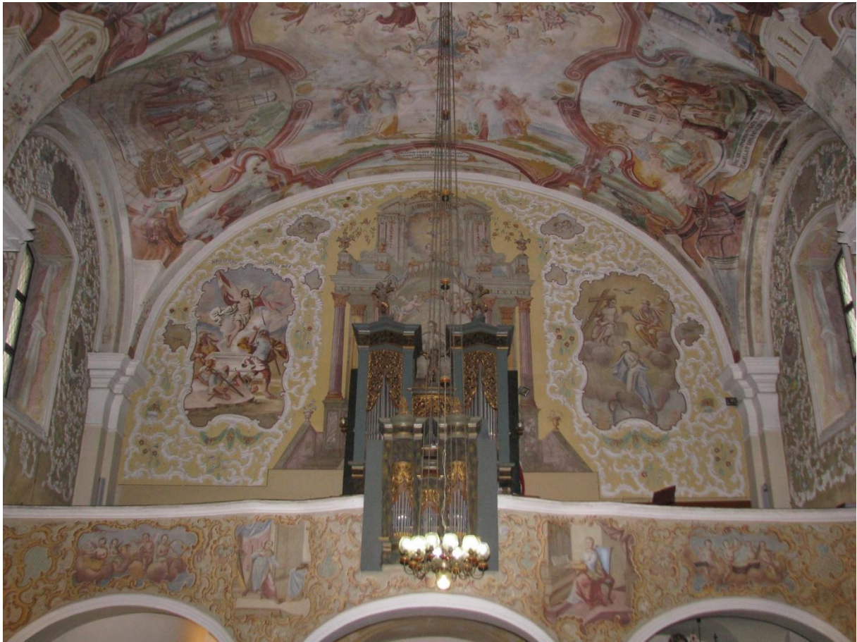
Prilog 19. Pogled na pjevališta i dio svoda