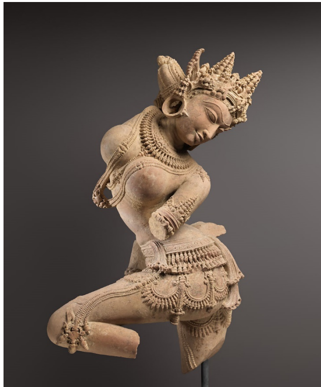
Indijska skulptura, Devata , 11 st.

U Indiji golo tijelo kao motiv u umjetnosti nije postojao, kada vidimo prikaze na prvi pogled izgleda kao da figure nemaju odjeću, ali kad se približimo vidimo šavove, linije oko zapešća, vrata i gležnjeva, razne ukrase i nakit. Ukras je izuzetno važan u kulturi Indije, jer u Indiji jedini ljudi koji nisu ukrašeni i nemaju nakit su ljudi koji tuguju. Vjerovali su kako ukrašavanje tijela donosi sreću, bogatstvo i dobar život.