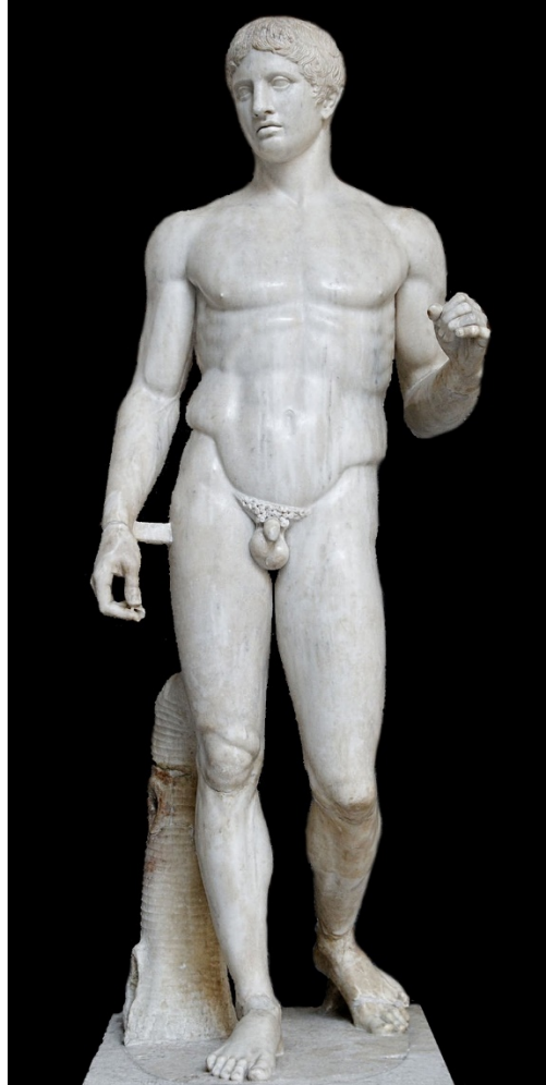
Poliklet, Dorifor ili Kopljonoša , 450 pr. n. e.

sasvim uobičajeno i normalno u grčkoj kulturi. Istraživači su tražili bilo kakve tragove antičke tradicije takve vrste i nisu ju uspjeli naći. To je koristilo ujedno i umjetnicima, jer atletima skidanje odjeće i boravljenje bez iste nije bilo strano.