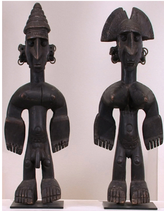
Bambara figurice, Mali, Zapadna Afrika, 1900 g. – 2010 g.

Ljudi često pregovaraju o raznim idejama koje se tiču identiteta, jedna od njih je kako prikazujemo svoj ili tuđi identitet kroz prikaz tijela. Tijelo u umjetnosti nam može dati neiscrpan izvor informacija te se može oblikovati kako bi nam poslalo određenu poruku; tijelo može prikazati imućnost, stalež, starost, spol... Spol uzimamo zdravo za gotovo kao nešto što je prirodno, ali kad počnemo razmišljati gledamo li prikaz muškog ili ženskog tijela u biti donosimo zaključke o tome kako ljudi inače prikazuju spolnost i koliko smo naviknuti na takav prikaz. Imamo zanimljiv primjer iz afričke države Mali i njihove etničke skupine Bambara. U prilogu niže vidimo dvije Bambara figurice koje reprezentiraju muško i žensko, figurice same po sebi su vrlo slične i po visini i po obliku glave, jedino što ih razlikuje su spolni organi koji nisu očit na prvi pogled. Prikaz tijela također povezujemo sa socijalnom ulogom, koliko je osoba više rangirana u društvu to je prikaz više ukrašen i veće je veličine. Interesantno je istraživati prikaz tijela određene kulture ili tradicije jer otkriva tijekom razmišljanja te kulture.