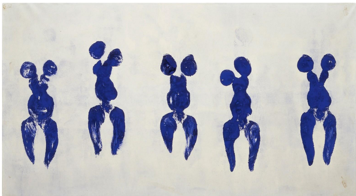
Y. Klein, Antropometrija u plavom , 1960.