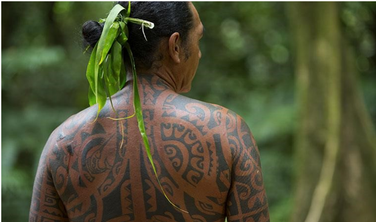
Primjer svete Polinezijske tetovaže

kako je tetovaža puna svetosti i duhovne moći. Na to utječe dolazak evanđeoskih misionara u Tahiti 1797. godine. Ovi misionari pomogli su izraditi prve pisane zakone u Tahitima. Jedan od tih izvornih zakona je da nije dopušteno tetoviranje. To je zbog zakona iz knjige Levitskog zakonika koji zabranjuje obilježavanje tijela i to je nešto što su kao kršćani vrlo ozbiljno shvaćali. Zbog toga tijelo postaje mjesto gdje ljudi pokušavaju prisiliti određeni koncept pojedinca i društva na lokalne ljude.