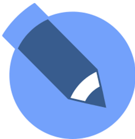
Slika 3. Logo društvene mreže LiveJurnal

Autori navode kako je do 1997. do 2001. godine nastalo nekoliko društvenih web-stranica koje su nudile razne kombinacije profila i javnih lista prijatelja. AsianAvenue , BlackPlanet i MiGente društvene mreže koje su bile usmjerene na određenu etničku skupinu ljudi, a omogućavale su svojim korisnicima stvaranje osobnih, poslovnih, ili pak profila za upoznavanje osoba. Kod dodavanja prijatelja nije bilo potrebe za njihovom potvrdom prijateljstva. Takve jednosmjerne poveznice među korisnicima pružao je i LiveJournal , koji je nastao 1997. godine. Korisnici su označili određenu osobu kao prijatelja kako bi nakon toga mogli pratiti njegove aktivnosti (npr. pisanje bloga ili dnevnika). (J. Grbavac, V.Grbavac, Pojava društvenih mreža kao globalnog komunikacijskog fenomena, 2014.)