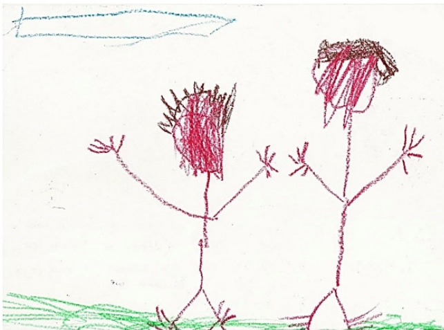
Slika 6. Luka, 7. god

glavoboljom. Crtežom dominira crna boja, dok je crvenom, ljubicastom i zelenom bojom prikazao trenutke kada ga manje boli glava. Dječak je kao likovnu tehniku izabrao akvarel. Prema linijama vidljivo je da se koristio debelim kistom. Linije su prikazane u različitim smjerovima, zbog čega crtež djeluje dinamičan i afektivan. Osim toga linije su guste, nejednolične i oštre.