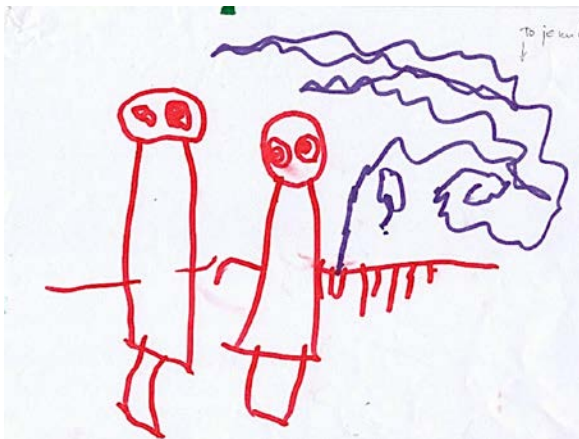
Slika 2. Paula, 4. god

Prvi dječji uradak prikazuje likove na način koji su karakteristični za fazu primarnih simbola. Svoju obitelj koja za dječaka predstavlja sreću nacrtao je koristeći nepravilne krugove i linije. Nije vidljiva ekspresija lica. Likovi su posloženi od najvećeg prema najmanjem, čime dijete ukazuje na važnost likova u njegovom životu. Iako su dječaku ponuđene različite likovne tehnike i između ostalog različite nijanse olovaka u boji on se odlučio samo za plavu.