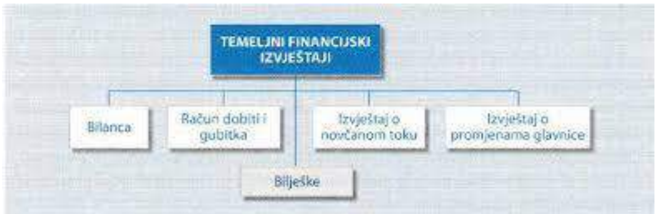
Slika 1: Prikaz temeljnih financijskih izvještaja.

Izvješće o poslovanju koje se prilaže financijskom izvješću ima širi ekonomski pristup, stavlja naglasak na korisnost podataka u procesu donošenja odluka, vodi računa o budućoj perspektivi, uvodi nefinancijske (opisne) informacije i prihvaća subjektivnu prosudbu uprave. Kao rezultat toga, predstavlja dodatak financijskom izvješću, povećavajući njegov informativni kapacitet.