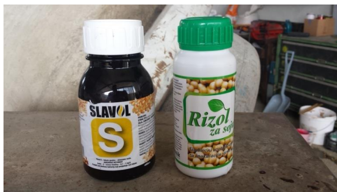
Slika 3. Poboljšivači za inokulaciju sjemena

Za uspjeh bakterizacije važno je da što veći broj bakterija preživi na inokuliranom sjemenu dok sjeme ne pusti korjenčić na koji će se one naseliti. O bakterizaciji ovisi puno faktora kao što su: sam postupak izvođenja bakterizacije i sjetve, pH tla, opskrba tla hranivima, agrotehnika, biološka svojstva sorte, problem nematoda, primjena pesticida, gnojidba mikro i makroelementima. Biljke soje na kojima su dobro razvijene kvržice sposobne su za dobro razvijanje listova zelene do tamnozeleno boje.