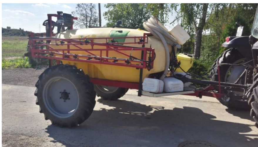
Slika 7. Prskalica za kemijsku zaštitu soje

U Garac P.O. u 2014. i 2015. godini nije korištena nikakva zaštita protiv bolesti jer smo to kvalitetno suzbili sa upotrebom sorti koji su otporne na bolesti i pravilnim plodoredom. Zaštitu protiv štetnika 2014. godine smo imali za crvenog pauka koji se pojavio u srpnju kada je duži period visokih temperatura. Tretirali smo ga sa Demitanom u dozi 0,5 l/ha.