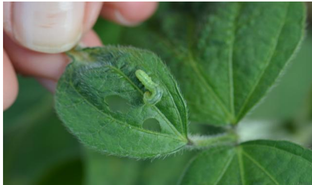
Slika 7. Lisne sovice na soji

Najveću štetu na soji mogu prouzročiti lucernina sovica, sovica gama, kupusna sovica, i druge vrste sovica (Pinova.com). Tijekom 2015. godine na obiteljskom poljoprivrednom gospodarstvu „Matinac Josip“, uočen je štetnik lisna sovica (Slika 7.) i obavljene su mjere suzbijanja. Za suzbijanje lisnih sovica koristio se insekticid „Nurelle D“ u koncentraciji 1-1,5 l/ha dana (17.08.2015.).