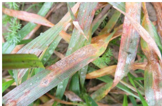
Slika 16. Smeđa pjegavost lista

Slika 15. prikazuje žutu hrđu pšenice koja se u 2015. godini pojavila na obiteljskom poljoprivrednom gospodarstvu „Matinac Josip“. (Slika 15.) uzročnik se pojavio na zelenom listu jer samo na njemu može i opstati, a utvrđena je na parceli „Dilein stan“. Za suzbijanje bolesti upotrijebljen je fungicid Amistar 250 SC tretiranje je obavljeno (07.05.2015.).