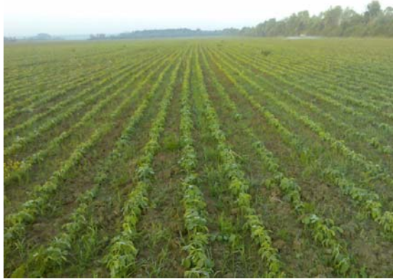
Slika 4. Soja sorte „Ika“ ( http://www.poljoprivredni-forum.biz/t953-sjetva-soje-2009 )

Slika 4. prikazuje sortu soje „Ika“ koja uspijeva na oranicama obiteljskog poljoprivrednog gospodarstva „Matinac Josip“. Soja sorte „Ika“ ubraja se u srednje ranu sortu (0-I grupe zriobe) koja je najraširenija u Republici Hrvatskoj. Vodeća je po površinama, ali i po urodu zrna. Visina ove sorte soje je otprilike oko 100 centimetara. Ističe se po tome što je bogata bjelančevinama i uljem. Stabljika „Ike“ je jako čvrsta i zbog toga je otporna na polijeganje. Osim toga, ova sorta soje ima toleranciju na glavne bolesti u usporedbi s ostalim sortama soje koje su slabije otporne na bolesti. Optimalni sklop je 580-600 000 biljaka/ ha. Vrijeme koje je pogodno za sjetvu sorte soje, „Ike“ je krajem travnja.