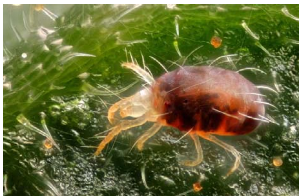
Slika 8. Crveni Pauk