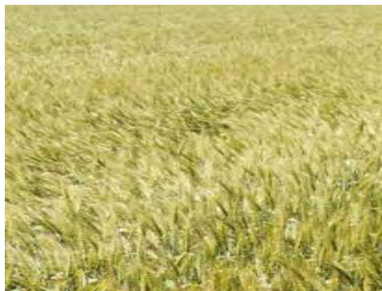
Slika 13. Pšenica sorte Kraljica ( http://www.poljinos.hr/pdf/PIOOSZ2014.pdf )

Sorta „Kraljica“ (Slika 13.) zasijana je na parceli „Pod Brdom“ na veličini od 5 ha. Ovu sortu ozime pšenice proizvođača „Poljoprivredni Institut Osijek“ karakterizira vrlo dobra otpornost na bolesti, polijeganje i niske temperature. Visina stabljike se kreće oko 75 cm, hektolitarska težina je prosječna do visoka, a masa tisuću zrna se kreće oko 40 grama.