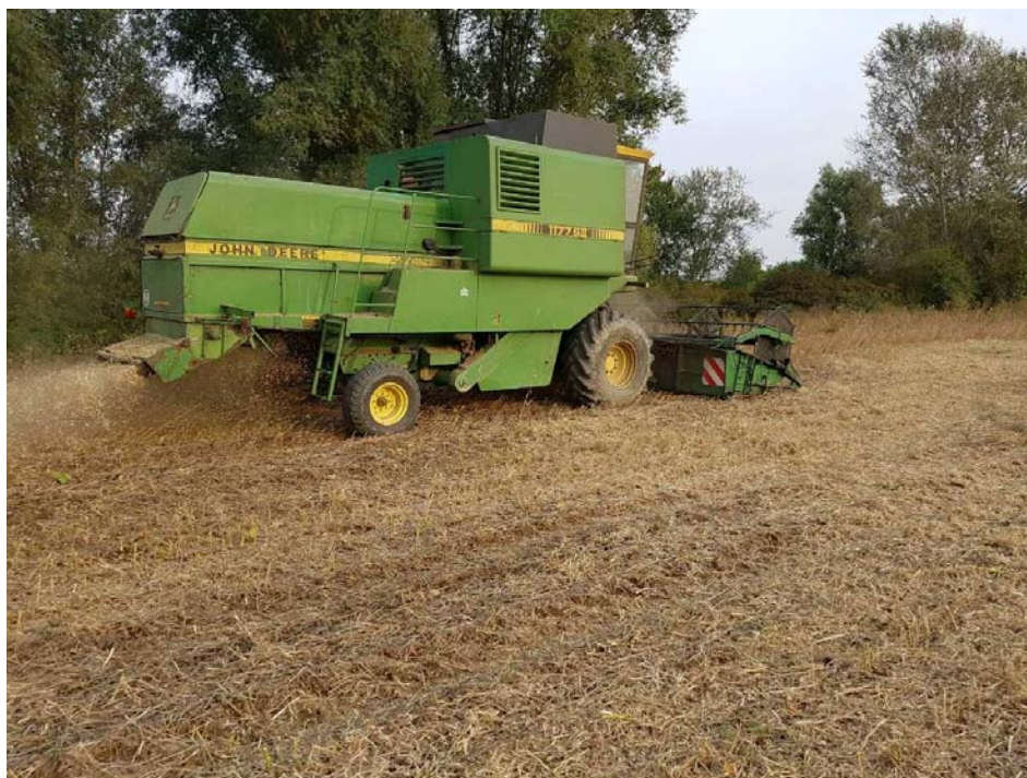
Slika 9. Žetva soje na OPG „Matinac Josip“

Osnovni cilj u uzgoju i proizvodnji soje je dobivanje visokih prinosa, zato je veoma važno odrediti pravi trenutak za žetvu. Žetva soje mora biti pravovremena jer ukoliko se vrši vlažna (više od 14% vlage), može doći do povećanja troškova proizvodnje, zbog dodatnog sušenja. Ako se zakasni sa žetvom i sjeme se previše osuši, može se dogoditi da dođe do većih gubitaka zbog pucanja mahuna te rasipanja zrnja po polju usred same žetve. Žetva soje na OPG „Matinac Josip“ obavljena je početkom rujna (Slika 9.) vlaga sjemena na parcelama je iznosila 12,2-13,3%. Prosječni prinos svih 5 parcela iznosi 2,5 t/ha (Tablica 2.).