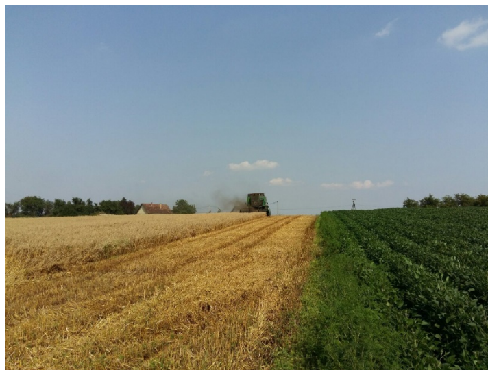
Slika 19. Žetva pšenice 2015. godine na OPG „Matinac Josip“ 1

Kod žetve pšenice treba pripaziti da se skida u fiziološkoj zrelosti zrna pri vlazi 13-14%. Žetva pšenice počela je 8. srpnja na parceli „Dilein stan“, a završila 10. srpnja na parceli „Pod brdom“ (Slika 19. i 20.). Očekivani prinos je bio zadovoljavajući i iznosio je 5,75 t/ha.