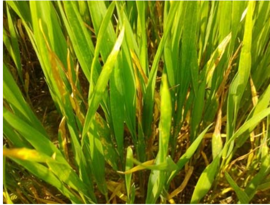
Slika 15. Žuta hrđa

( http://www.savjetodavna.hr/adminmax/images/savjeti_2014/zuta_hrda_11_4.jpg )