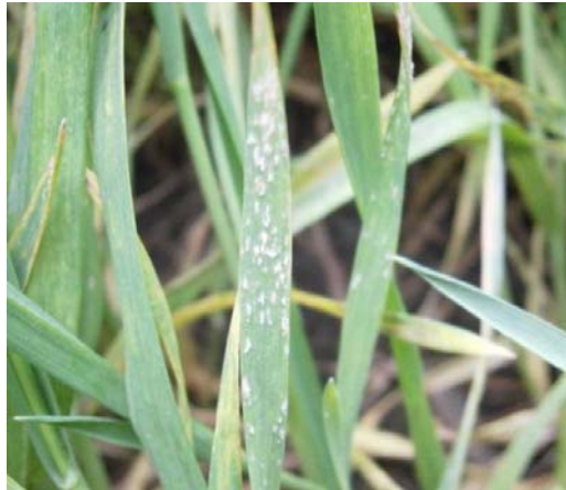
Slika 14. Pepelnica

( http://www.pisvojvodina.com/RegionVSS/Lists/Photos/P%C5%A1enica/_w/Pepelnica%2031.03.jpg.jpg )