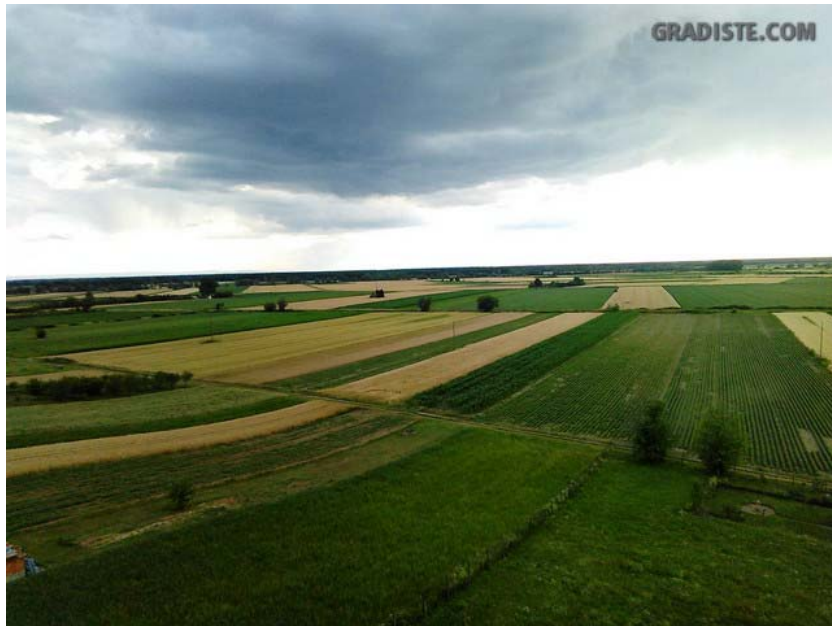
Slika 2. Polja u Gradištu ( www.gradiste.com/komentar.asp?id_vij=737 )