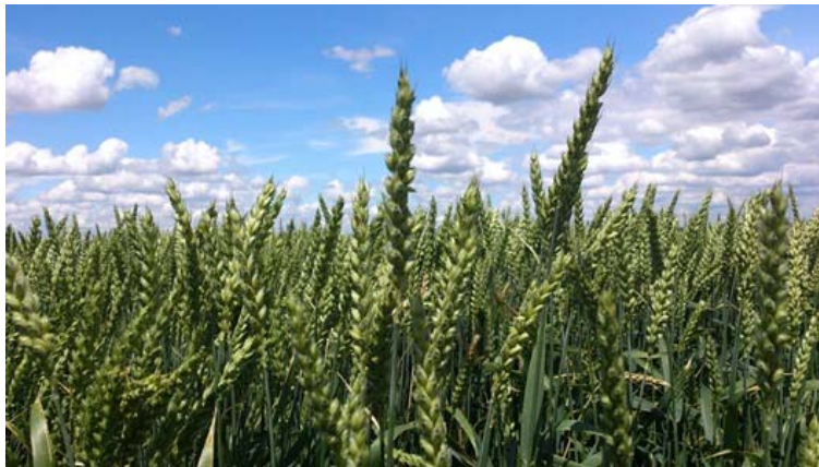
Slika 12. Pšenica sorte Graindor ( http://www.bioizvorb.rs/slike/novosti/nov8.jpg )

Na obiteljskom poljoprivrednom gospodarstvu „Matinac Josip“ zastupljene su dvije sorte ozime pšenice, a to su Graindor i Kraljica. Graindor (Slika 12.) je visoko prinosna krušna pšenica proizvođača „RWA“. Na ovom OPG-u uvedena je u uporabu 2014. godine. Visina stabljike je oko 92 cm, vrlo dobre otpornosti na polijeganje. Ima relativno dobru tolerantnost na hrđe i fuzarioze. Dobre je otpornosti na proklijavanje, hektolitarska težina je prosječna do visoka, a masa tisuću zrna iznosi oko 42 grama.