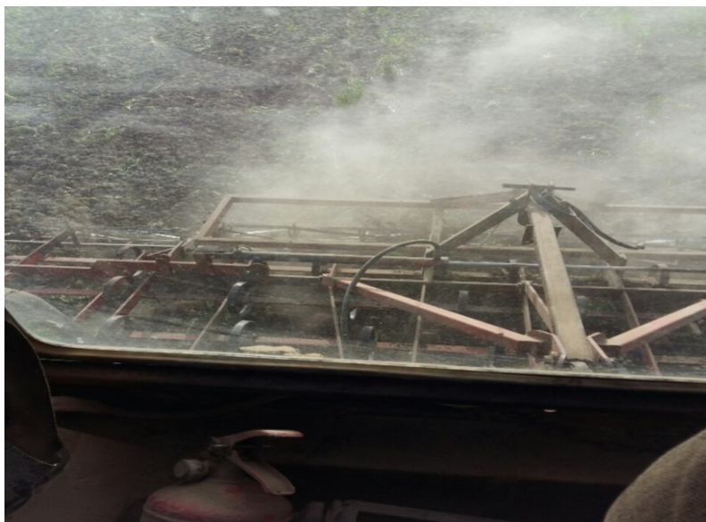
Slika 10. Sjetvospremač „Rau“