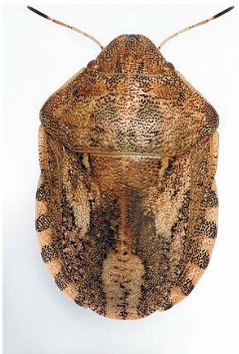
Slika 18. Žitna stjenica

( http://agronomija.rs/wp-content/uploads/2013/11/Eurygaster-maura-zitna-stenica.jpg )