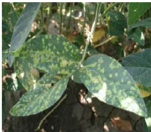
Slika 5. Plamenjača na listu soje

Dvije su se bolesti pojavile na obiteljskom poljoprivrednom gospodarstvu „Matinac Josip“ tijekom 2015. godine. Prva i u najvećoj mjeri je plamenjača ( Peronospora manshurica ) (Slika 5.), a druga bolest poznata je pod nazivom smeđa pjegavost ( Septoria glycines ).