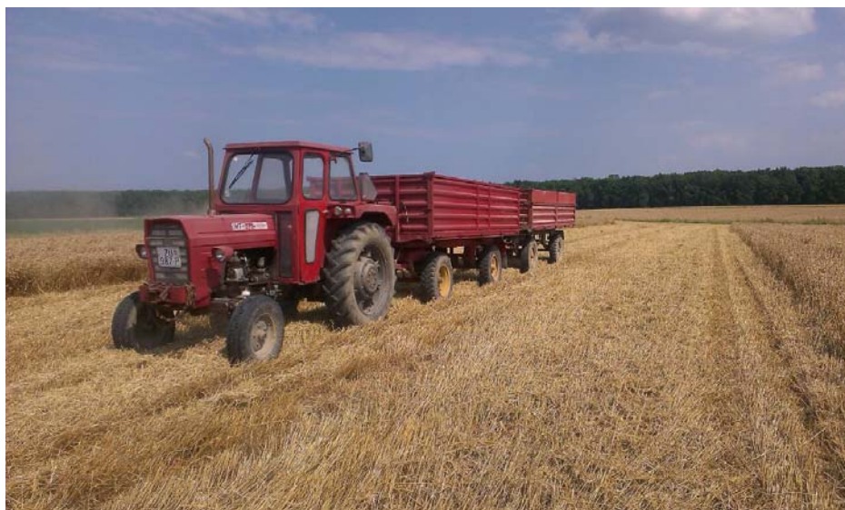
Slika 20. Žetva pšenice 2015. godine na OPG „Matinac Josip“ 2