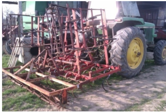
Slika 1. Kultivator OPG „Matinac Josip“