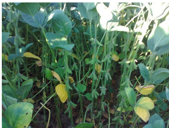
Slika 3. Soja sorta „Podravka 95“

Dvije su sorte soje koje su većinom zastupljene na obiteljskom poljoprivrednom gospodarstvu „Matinac Josip“ u 2015. godini, a to su „Podravka 95“ i „Ika“ (Slika 3, 4).