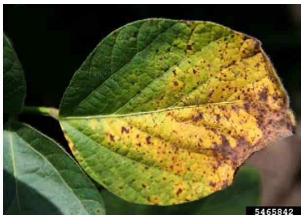
Slika 6. Smeđa pjegavost soje

Slika 6. Prikazuje bolest soje koja se pojavila na obiteljskom poljoprivrednom gospodarstvu „Matinac Josip“ u 2015. godini. Bolest je poznata pod nazivom smeđa pjegavost soje ( Septoria glycines ) koja se pojavila na manjem broju biljaka. Simptomi karakteristični za smeđu pjegavost soje su male smeđe pjege koje se spajaju a moguće je sušenje donjih listova. Na obiteljskom poljoprivrednom gospodarstvu „Matinac Josip“ bolest je uočena sredinom srpnja. Iako se ova bolest pojavila na OPG „Matinac Josip“, nije zabilježena veća zaraza obzirom da su članovi „OPG Matinac Josip“ koristili tolerantnije sorte, duboko zaoravali zaražene žetvene ostatke i vodili računa o plodoredu.