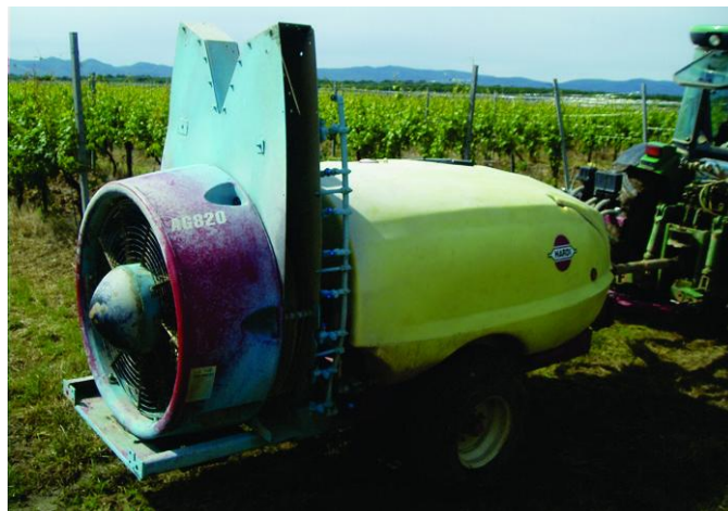
Slika 1. Raspršivač Hardi Zatrurn

Hardi klipno - membranska crpka je instalirana na raspršivaču, kapacitet je 140 l/min pri radnom tlaku od 20 bara. Model crpke koji je instaliran na raspršivaču je 363 i ima dvije membrane.