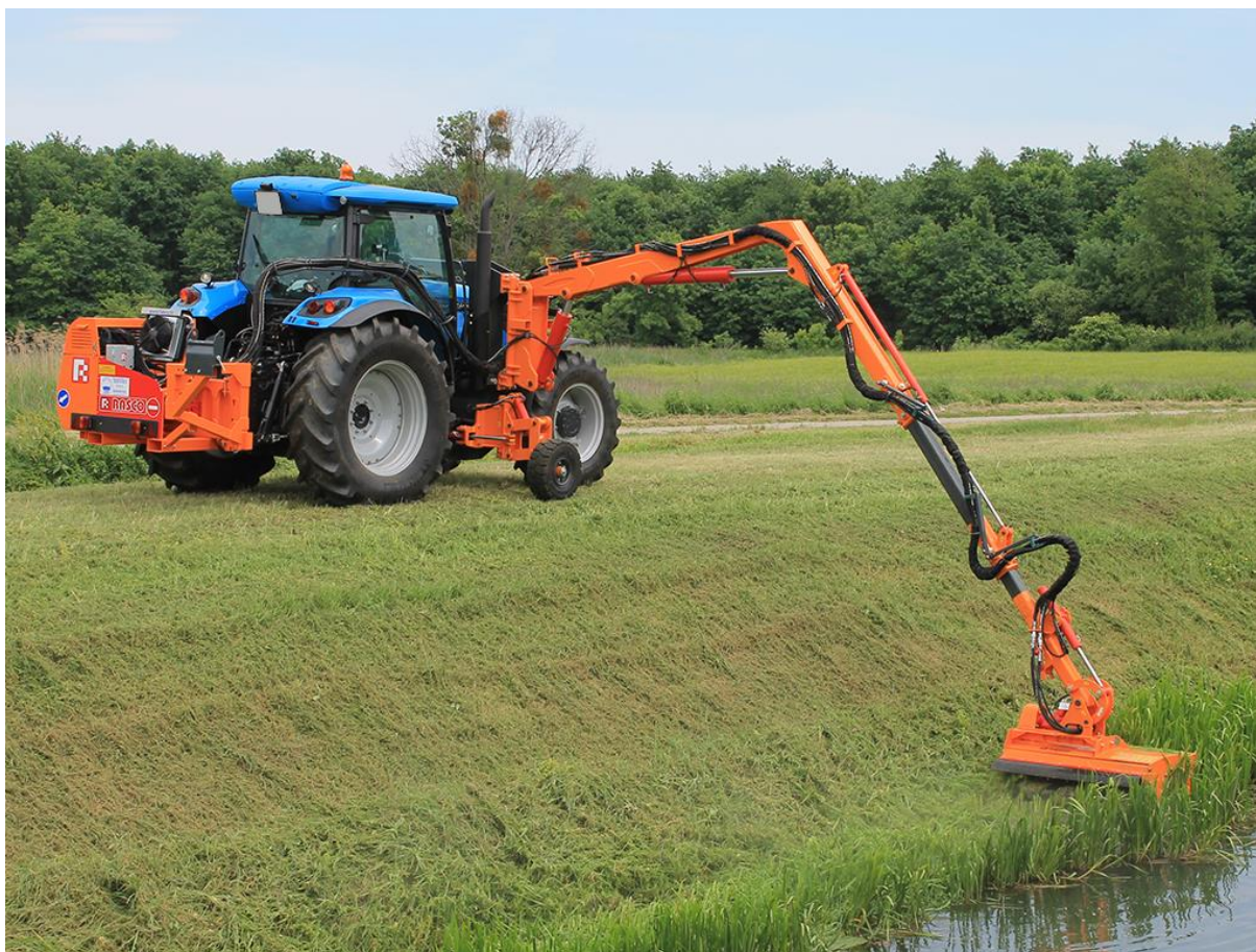
Slika 7. Održavanje kanala uz poljoprivredne površine

Košnja je jedna od najčešćih i učinkovitijih preventivnih mjera (Slika 7.). Ako se obavi prije početka generativne faze, možemo učinkovito smanjiti broj korova na nekim površinama. Najbolje je iskoristiva na antropogenim površinama poput cesta, kanala, jaraka, itd. Košnja nam isto omogućuje da iscrpimo biljku. Uništavanjem nadzemnoga dijela biljke, prisiljavamo tu biljku da nadoknadi izgubljenju stabljiku te ju tako možemo oslabiti da ne dođe do generativne faze.