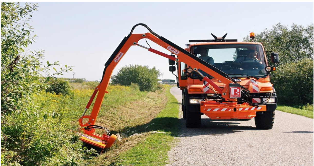
Slika 3. Košnja korova uz puteve

Zbog veličine korovnog zrna, to zrno se često može pomiješati sa zrnom kulturnih biljaka i tako se nekontrolirano širiti na druga polja. To možemo spriječiti uklanjanjem korova s polja prije žetve, a vrlo je važno i koristiti certificirano sjeme profesionalnih proizvođača. Ta sjemenska smjesa je nešto skuplja, ali nam daje garanciju da je čista od korovnih zrna i da je tretirana protiv ostalih štetnika. Ovo je jedan od najboljih načina u borbi protiv korova i bolesti.