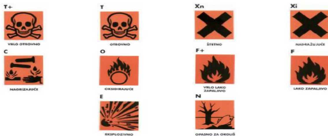
Slika 15. Oznake opasnosti na poljoprivrednim sredstvima

Kod korištenja moramo imati na umu karencu (najkraće razdoblje koje mora proći od uporabe sredstva do korištenja tretiranog proizvoda). Ona nam govori kada je neko sredstvo toliko razgrađeno da je sigurno koristiti prskane plodove ili biljke. Upute za karencu moraju se dobiti uz sredstvo. Za većinu sredstava je važna količina sredstva koje su potrebne da dođe do trovanja. To nazivamo toleranca. Toleranca je maksimalna dopuštena količina aktivne tvari nekoga sredstva za zaštitu u ili na namirnicama. Tolerance su zakonski propisane te se nadopunjuju kroz znanstvena istraživanja.