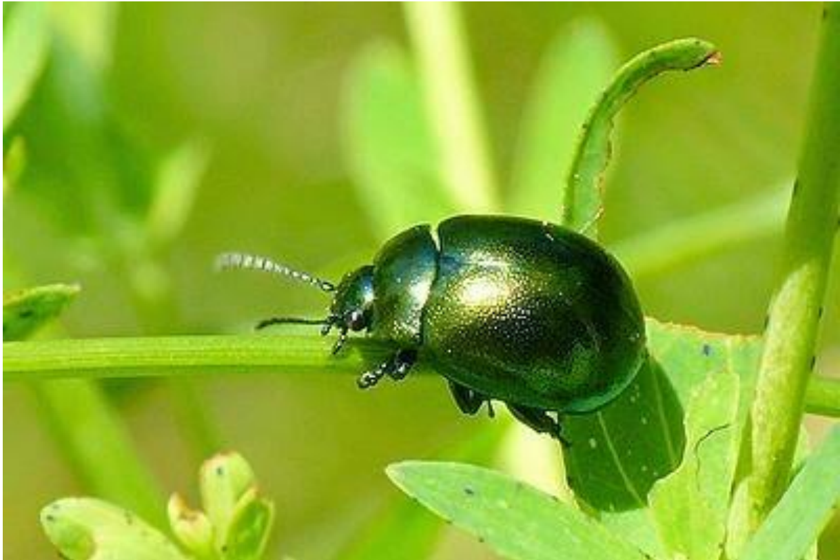
Slika 11. Zlatica ( Chrysolina quadrigemina ) napada kantarion

isplativija jer se kukci sami razmnože (Slika 11.). Ali kod ovih operacija moramo biti oprezni da ne poremetimo prirodnu ravnotežu postojećih ekosustava. Kukci mogu skočiti na domaće biljke ako se ne obave dobre analize korova koje želimo ukloniti. Pod ove mjere možemo uvrstiti i živi malč, tj. biljni pokrov koji nam služi da pokrije međuredne površine na poljima i tako spriječi razvoj korova.