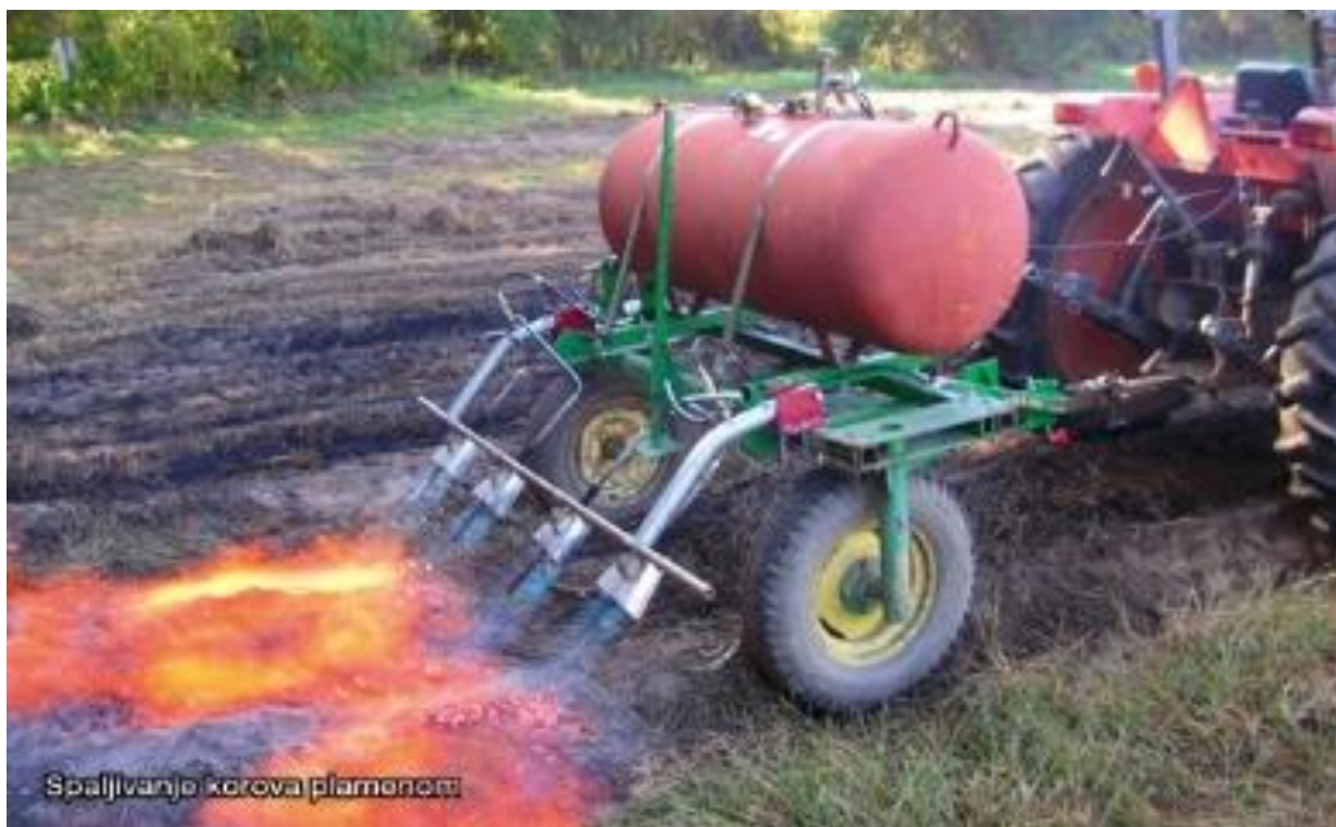
Slika 10. Stroj za suzbijanje korova plamenom