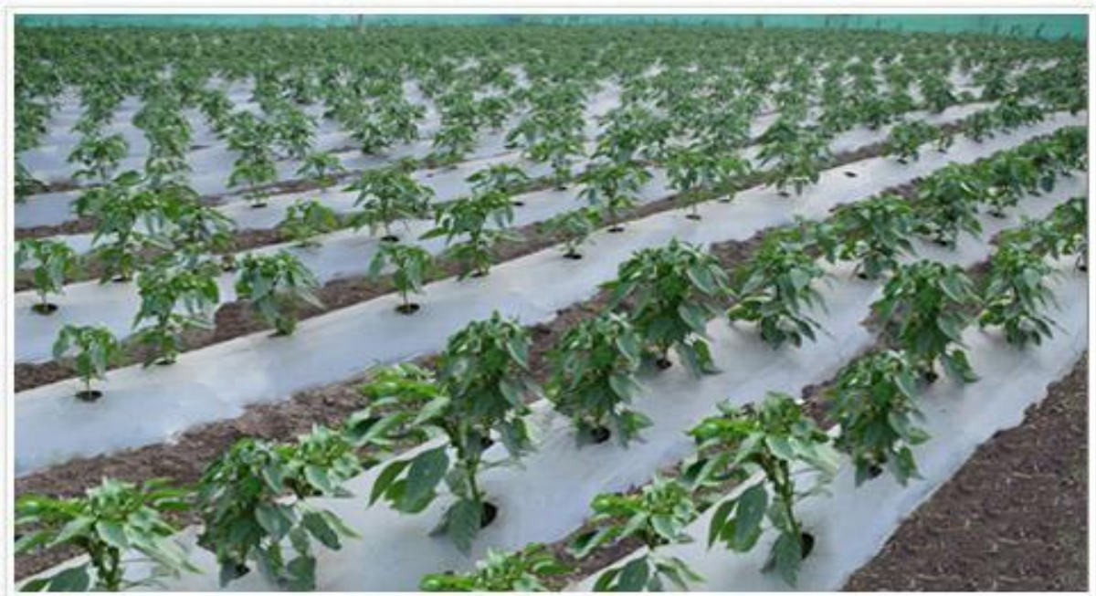
Slika 6. PVC pokrivač u uzgoju povrća

Plodored je mjera koja smanjuje mogućnost dominacije štetnika, a ako se ne provodi može dovesti do snažnijeg širenja korova koji se nalaze i razvijaju u određenim kulturama. Plodored zahtijeva različite agrotehničke mjere svake godine te i to utječe na mogućnost prilagodbe korova na polju.