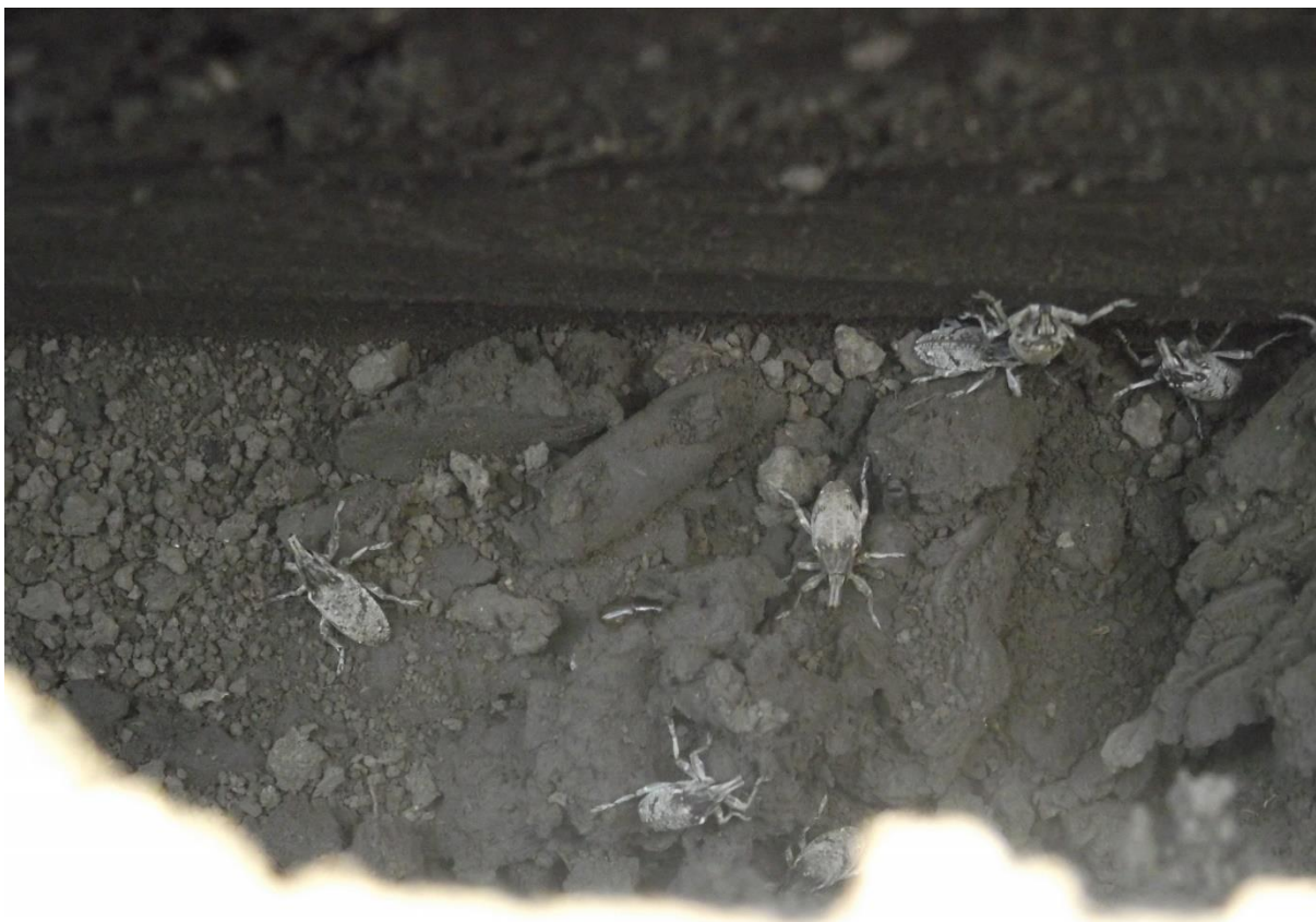
Slika 17. : Lovni kanal za repinu pipu