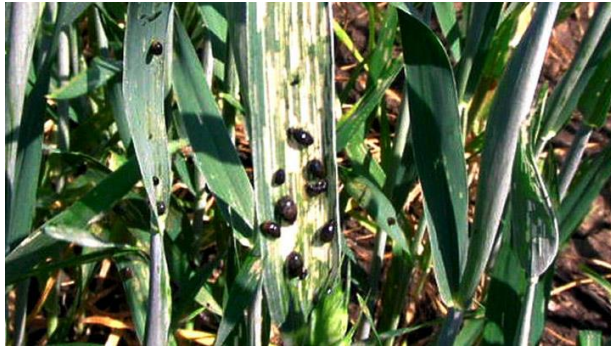
Slika 3. Oulema melanopus ličinka

Suzbijanje - Jedna od preventivnih mjera je duboka jesenja obrada tla, gdje se žitni balac unosi u dublje slojeve i tako se uništava. Kod jačeg napada tijekom vegetacije, osnovno suzbijanje ličinki vrši se kada je utvrđena 1 ličinka po zastavici. Ranim uočavanjem može se dobro suzbiti tretiranjem rubnih dijelova parcela, a kasnije cijelog usjeva. (Ivezić 2008.) Suzbijanje ovog štetnika obavlja se od sredine travnja.