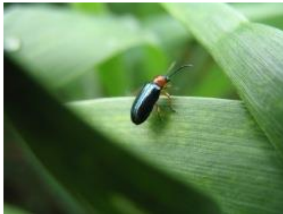
Slika 4. Oulema melanopus imago