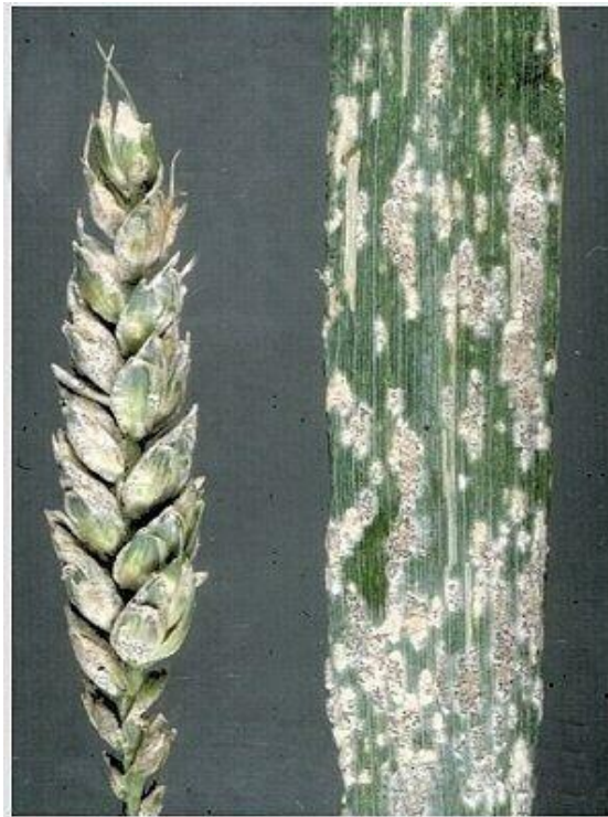
Slika 11. Erysiphe graminis (foto:

Suzbijanje - tretiranje fungicidima, izbalansirana gnojidba, plodored, sjetva otpornih sorata, te izbjegavanje gustog sklopa.