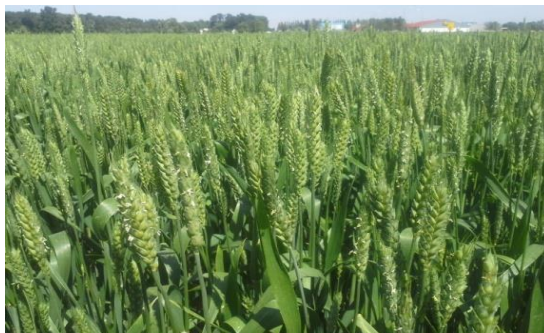
Slika 17. Sorta pšenice Katarina