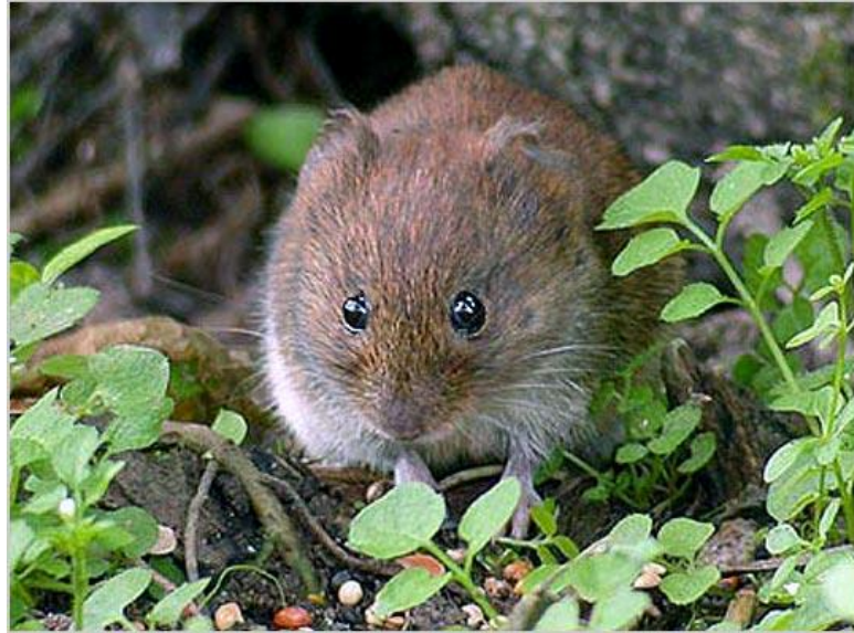
Slika 10. Microtus arvalis

Suzbijanje – za suzbijanje se koriste rodenticidi.