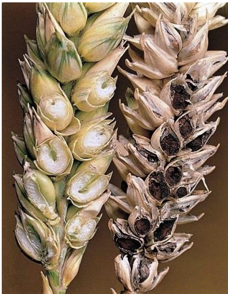
Slika 12. Tilletia tritici

Suzbijanje - Sjetva zdravog, doradenog i tretiranog sjemena, suzbijanje korova, plodored.