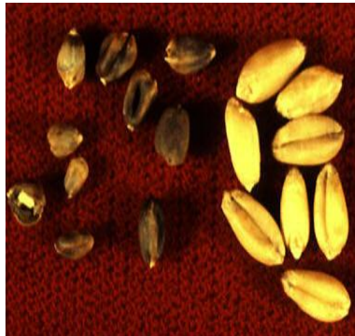
Slika 9. Zrno pšenice lijevo - napadnuto zrno, desno - zdravo zrno