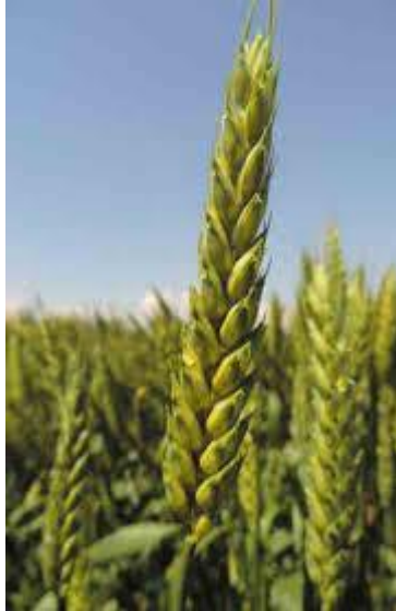
Slika 18. Klas pšenice Srpanjka (foto: http://www.poljinos.hr/pdf/PIOOSZ2014.pdf )