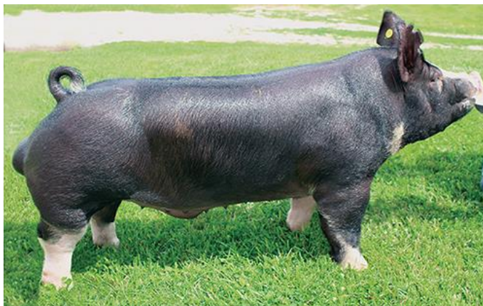
Slika 8. Berkshire

su tanke i kratke. Koža i dlaka su crne boje (Kralik, 2007.). Čekinje crne boje, ravne i srednje duge, sa bijelim oznakama na perifernim dijelovima nogu, glave i repa. Krmače daju 6 – 12 prasadi u leglu.