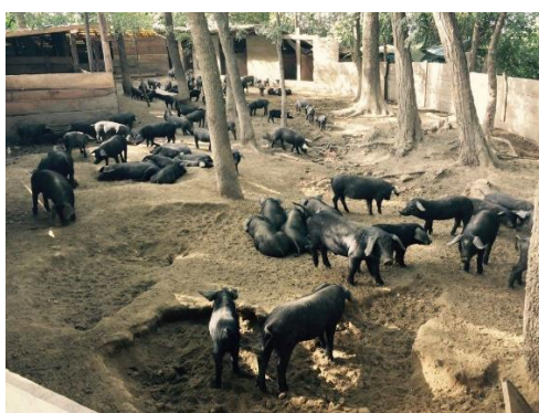
Slika 11. Uzgoj crne slavonske svinje na otvorenom

svinja koji potječu iz takvih sustava uzgoja. Uzgojne sustave možemo podijeliti na intenzivni, poluintenzivni i ekstenzivni način uzgoja. Dok se intenzivni sustav bazira na uzgoju plemenitih pasmina svinja s velikim tovnim svojstvima te hibrida, ekstenzivni uzgoj se koristi u proizvodnji većinom domaće autohtone pasmine. Držanje autohtonih pasmina ima brojne prednosti pa su one tako puno otpornije na bolesti, otpornije su na stres, imaju veću mogućnost aklimatizacije na različite vanjske uvjete, iskorištavaju nisko vrijedna krmiva te za razliku od intenzivnog sustava pojeftinjuju proizvodnju (tablica 1.) (Margeta i sur., 2015.).