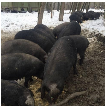
Slika 1. Crne slavonske svinje

Crna slavonska svinja pripada skupini prijelaznih pasmina svinja koje su nastale selekcijom i križanjem domaćih pasmina. Prema proizvodnim karakteristikama pripada masno – mesnom tipu svinja (Kralik, 2007.). Kasnozrela je, srednje veličine (Poljak, 2011.), trup je kratak s dubokim i širokim prsima, ravnih leđa, butovi su dobro razvijeni, a noge kratke i tanke, ali čvrste (Uremović, 2004.). Koža crne slavonske svinje je tamno pigmentirana, pepeljasto sive boje s rijetkim, potpuno crnim i ravnim čekinjama. Glava je duga, konkavnog profila u širokom čeonom dijelu, dok je u nosnom dijelu ravna, a uši poluklempave. Rilo i papci su crni. Visina grebena je oko 68 cm, a težina odraslih svinja kreće se oko 270 kg (Poljak, 2011.). U intenzivnom tovu (14 – 16 mjeseci) crna slavonska svinja može postići masu od 180 do 200 kilograma (Kralik, 2011.).