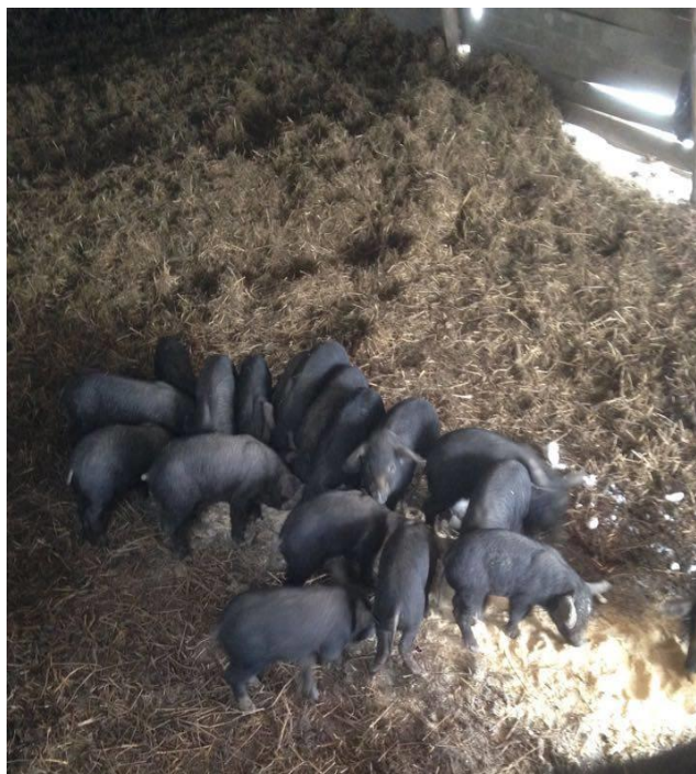
Slika 5. Uzgoj prasadi na dubokoj stelji

mesa je svjetloružičasta. Udio mišića u polovicama na liniji klanja iznos od 32,59 do 42,59 %. U gospodarskom smislu od crne slavonske svinje treba istaknuti vrlo kvalitetne suhomesmate proizvode, od kojih je najpoznatiji slavonski kulen (Karolyi i sur., 2010). Također, kakvoća prerađevina ovisi i o sastavu masnih kiselina u unutarmišićnoj masti koji je u usporedbi s plemenitim pasminama bolji kod crne slavonske svinje (Uremović, 2004.).