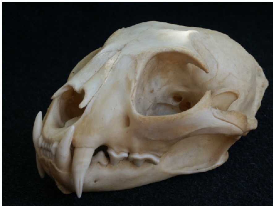
Slika 6. Lubanja risa

Pojava drugog donjeg kutnjaka M2 (5,1%) je, međutim, niža u odnosu na druge populacije. Ris ima 28 zubi , zubne formule I 3/3, C 1/1, P 2/2, M 1/1. Lubanje muških jedinki su veće u odnosu na lubanje ženskih jedinki. Ovim istraživanjem utvrđeno da se kranimetrijske vrijednosti populacije balkanskog risa, statistički značajno ne razlikuju od hrvatske i češke populacije.