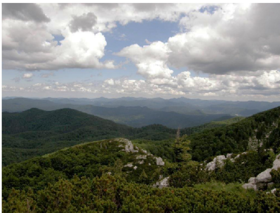
Slika 2. Staništa pogodna za obitavanje populacije risa na području Nacionalnog parka „Risnjak“ u Gorskom kotaru

Aktivnost je ovisna o spolu, reprodukcijском statusu i vremenu proteklom od posljednjeg lova. Prisutnost zdrave populacije risa pokazatelj je očuvana i bogata staništa koje je važno i za mnoge ljudske aktivnosti – turizam, rekreaciju, lov, izvor je hrane te nemjerljivo prirodno bogatstvo. Činjenica da je ris prisutan u našim šumama dodatna je vrijednost za hrvatski ekoturizam i naš je nacionalni ponos.