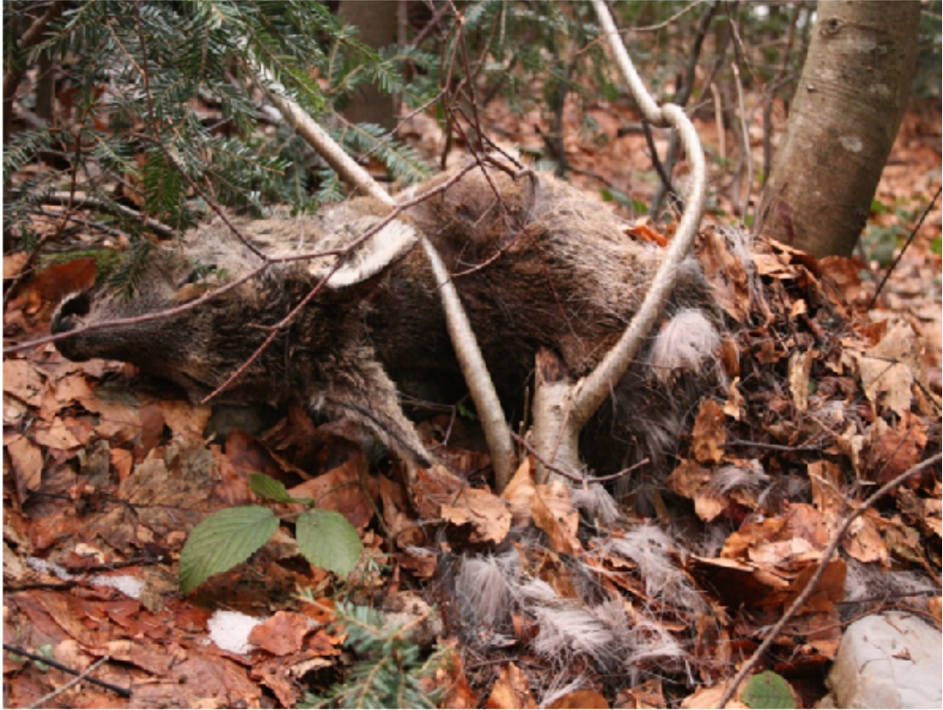
Slika 3. Risov plijen