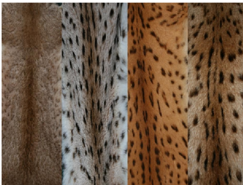
Slika 4. Različiti uzorci na krznu risa

Savijenim leđima, napetim mišićima i podignutom dlakom ris se doima veći i opasniji svom napadaču. Ris se sezonski linja, mijenja dlaku ovisno o godišnjem dobu, ljeti je rjeđa i lakša, dok je zimi gušća (Slika 4).