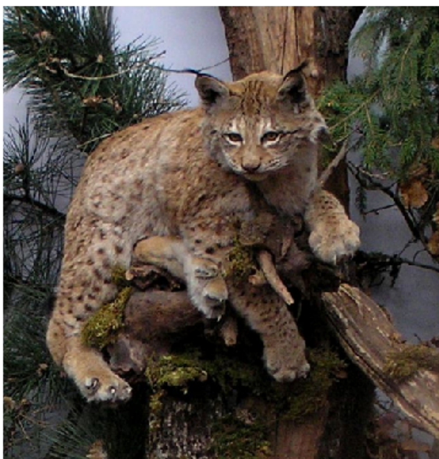
Slika 1. Euroazijski ris

Tijelo je pokriveno gustim tamno ili crvenkasto – sivim krznom, uz karakteristične tamne pjege, podbradak, grudi i trbuh su bijeli. Na vrhu šiljastih uški raste pramen crnih dlaka do 4 cm dugačkih. Kao i sve mačke, risovi imaju okruglaste glave kratke njuške, a u zubalu im se nalazi 28 zuba s jakim očnjacima i kutnjacima oštarih rubova, iako ponekad ris može imati još dva zuba (prekutnjaci), ali oni u starijih jedinki otpadnu. Ovaj predator ima jako razvijene osjete vida, sluha, opipa i njuha ( http://wildlife.blogger.ba , 15.11.2015.)