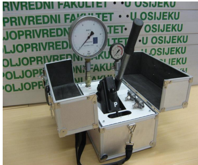
Slika 7. Komparator tlaka Volos

minimalni promjer od 63 mm, te točnost manometra koji se ispituje mora biti \pm 0,2 bara kada se radi o ispitnom području od 0 do 2 bara. Ako se radi o većem ispitnom području odstupanje može iznositi do \pm 10 %.