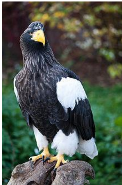
Slika 11. Stellerov orao ( http://en.wikipedia.org/wiki/Steller%27s_sea_eagle )

Stellerov orao (Slika 11) obitava u sjeveroistočnoj Aziji. Ovo je najteži orao na svijetu s prosječnom masom od 5 do 9 kg. Ženke imaju masu 6,8–9 kg, mužjaci 4,9–6 kg. Dužine su od 85 do 105 cm s rasponom krila 1,95 –2,5 m. Stellerov orao ima tamnosmeđu do crnu boju perja na tijelu s bijelom bojom na gornjem dijelu krila uz prsa, bijelim perjem na nogama i repu. Prvo perje kod ptica je bijele boje, a ubrzo dobiju sivo-smeđe perje.