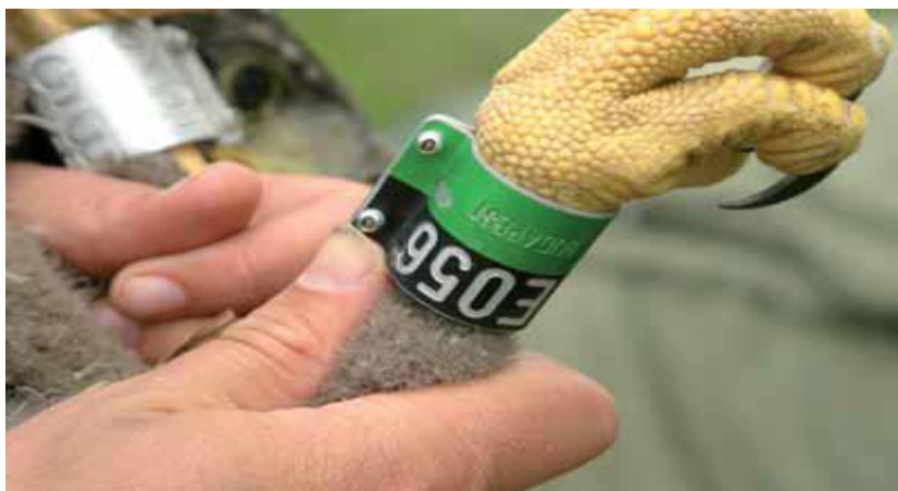
Slika 15. Prstenovani orao štekavac s mađarskom oznakom korištenom u razdoblju 2005.–2007.godine