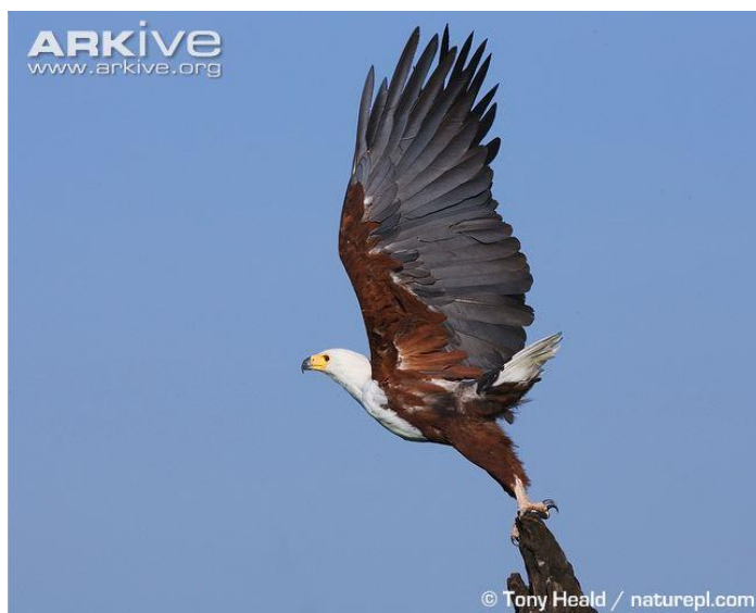
Slika 8. Madagaskarski orao ribar

Madagaskarski orao ribar (Slika 8) obitava u područjima madagaskarskih šuma. Endemska je vrsta Madagaskara gdje u malom broju živi na zapadnoj obali otoka. Dužina tijela je 60–66 cm, s rasponom krila 165–180 cm i mase 2,2–2,6 kg kod mužjaka i 2,8–3,5 kg za ženke.