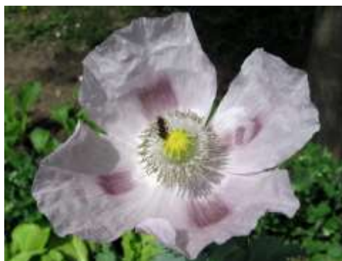
Slika 5.: Cvijet vrtnog maka

Cvjetovi su veliki, sastoje se od 2 lapa i 4 laticice čije boje mogu varirati, a pri dnu mogu imati tamne mrlje. U cvijetu se nalazi 150 – 250 prašnika koji čine pet koncentričnih krugova te jedan tučak. Svojstva cvjetova, tobolaca i sjemenki ovise o namjeni, npr. kod ukrasnog maka prisutan je veći broj laticice (Pospišil, 2013.). One su obično su bijele, iako boje mogu varirati od bijelo-crvenkaste do ljubičaste. Budući da do oplodnje može doći i prije otvaranja cvijeta, pretežito je samooplodan, no može biti i stranooplodan. Vrijeme cvatnje je od svibnja do kolovoza. Pojedinom cvijetu najčešće je potreban jedan dan da procvate. Najprije cvate cvijet na glavnoj stabljici, a zatim oni na bočnim granama (Pospišil, 2013.). Nakon otvaranja cvjetnog pupa, prašnici počinju sipati pelud koja pada na njušku tučka. Nakon oprašivanja cvijet počinje venuti, prašnici se osuše, a laticice naglo otpadaju.