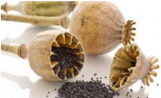
Slika 7.: Zreli tobolci i sjeme maka

Na tim pregradama nalazi se sjeme koje je sitno i bubrežasto, te je najčešće plavkaste ili bijele boje. Kada sjemenke sazriju, odvajaju se od pregrada i padaju na dno ploda. Masa 1000 sjemenki iznosi oko 0,40 – 0,50 grama, a hektolitarska težina je oko 50 – 60 kilograma (Gagro, 1998.). U stijenkama tobolca dobro su razvijene tzv. „mliječne žlijezde“, koje izlučuju mliječni sok, opijum ili lateks. U punoj zriobi tobolci sadrže oko 90% ukupnih alkaloida u biljci (Pospišil, 2013.).