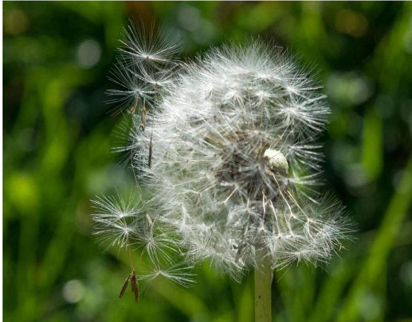
Slika 4. Plod maslačka