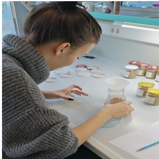
Slika 13. Procjena mortaliteta odraslih jedinki R. dominica