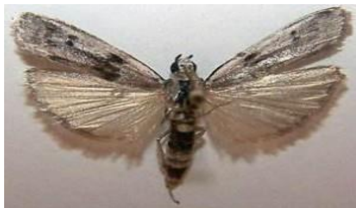
Slika 7. Brašneni moljac ( Anagasta kuehniella Zell.)

Leptir ima sivkasta krila s crvenim prugama raspona 22-25 mm (slika 7.). Gusjenice se hrane prvenstveno brašnom i sličnim proizvodima, a zapredaju ih u veće hrpe. Tijekom jednog dana može tridesetak gusjenica zapresti 1 kg brašna. Zapredene hrpice brašna mogu začepiti cijevi i strojeve u mlinovima.