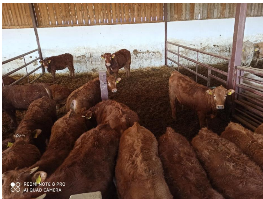
Slika 9. Limousine pasmina