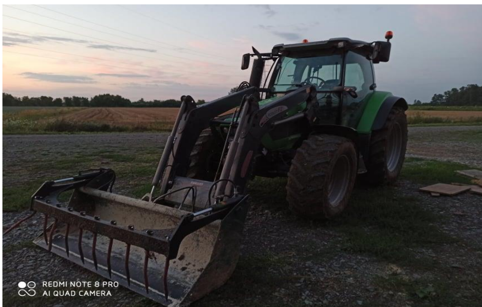
Slika 3. Deutz Fahr Agrottron, K420