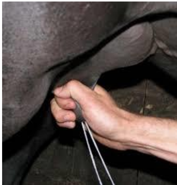
Slika 1. Ručna mužnja kobila

Mlijeko iz sise se izmuzuje u posudu laganim stiskom između palca i kažiprsta u njenom bazalnom dijelu i povlačenjem prema vrhu sise (Alatrović i sur., 2017.). Izmuzuje se i u vidu dva mliječna mlaza radi postojanja dva sisna kanala u svakoj sisi. Postupak se ponavlja sve do završetka mužnje. Tijekom mužnje prvo se izmuzuje mlijeko iz cisterne sise i vimena, potom iz kanala i alveola vimena. Stoga se tijekom mužnje uočava prva faza mužnje u kojoj se izmuzuje mlijeko iz cisterni, zatim slijedi jedna kraća faza „slijepe mužnje“ u kojoj djelovanje oksitocina nije izraženo te slijedi drugi val alveolarnog mlijeka koje se sintetizira u vimenu neposredno tijekom mužnje pod utjecajem oksitocina (Ivanković i sur., 2014.).