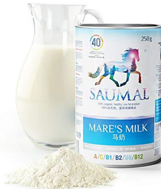
Slika 7. Mlijeko kopitara u prahu

Mlijeko u prahu može biti sirovina za preradu ili se koristi za konzumaciju, jer mu se na taj način produžuje rok upotrebljivosti, jednostavniji je transport te manji troškovi skladištenja. Za proizvodnju praha iz mlijeka kopitara koristi se nekoliko metoda. Najpoznatija metoda je „spray drying“. Ovom metodom se dobije prah, koji se teže topi u vodi. Temperatura mlijeka diže se na preko 80°C, dolazi do koagulacije bjelancevina i degeneracije masnih kiselina te umanjene funkcije svih sastojaka mlijeka. Bolja metoda je vakumsko sušenje, koje manje zagrije mlijeko u tijeku postupka sušenja, ali isto dolazi do smanjenja biološke vrijednosti u odnosu na sirovo mlijeko kopitara. Najbolja i najskuplja metoda sušena je „freeze drying“ metoda u kojoj se dobije prah niske specifične mase, bijele boje i sa svojstvima koje se ne razlikuju od svježeg sirovog mlijeka kopitara. Mlijeko kopitara u prahu se pakira u vrećice od 200 do 250 g ili u kapsule (Alatrović i sur., 2017.).