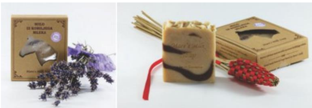
Slika 9. Sapun od kobiljeg mlijeka napravljen hladnim postupkom

Proizvodnja sapuna se izrađuje putem dva postupka: saponifikacija masti i ulja i karbonatna saponifikacija slobodnih masnih kiselina. Za izradu sapuna se koristi kaustična soda, nagrizajuće i otrovno sredstvo. Osnovu sapuna čine ulja: kokosovo, palmino, kikirikijevo, sojino, maslinovo, ricinusovo, avokado i bademovo ulje. Koriste se za sapune jer imaju veliki udio vitamina E, A i B kompleksa. Djeluju na kožu umirujuće, te ju čiste i hidratiziraju (Sekulić, 2018.).