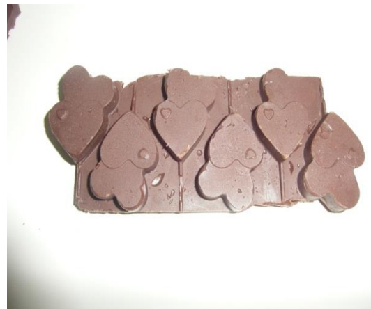
Slika 28. Čokolada u velikom kalupu (Janković, 2019.)

Čokolada sadrži veliki udio suhe tvari kakovih dijelova. Polifenoli u kakaovom zrnu imaju pozitivne učinke na zdravlje ljudi, zbog čega se kakao ubraja u glavnu namirnicu svake čokolade. Na tržištu se sve više pojavljuju čokolade s manjim udjelom šećera, te bogatim funkcionalnim sadržajem. U proizvodima čokolade koriste se termolabilne sirovine, različitih aroma i tekstura, te je za izradu kvalitetnog proizvoda bitan svaki detalj.