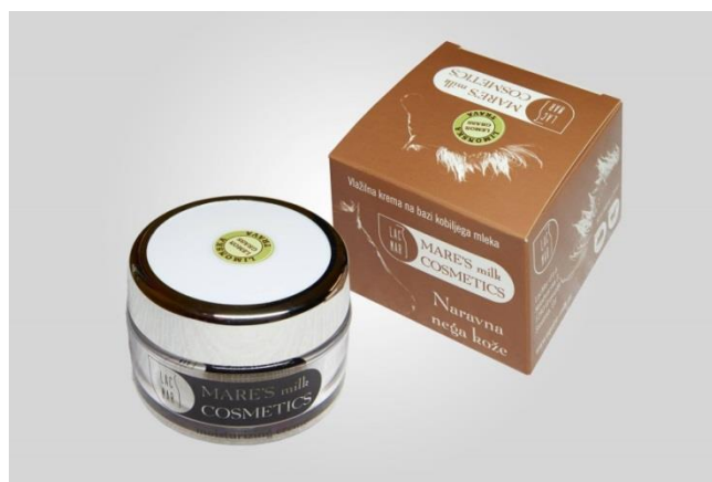
Slika 8. Krema od kobiljeg mlijeka

Kobilje mlijeko u kremama smanjuju bore, povećava elastičnost i hidrataciju kože, te smanjuje pigmentiranost pojedinih dijelova kože. Kreme od kobiljeg mlijeka upotrebljavaju za smanjenje crvenila kože i manje upale. Dobre su za kožu lica jer hidratiziraju suhu i ispucanu kožu, te joj vraćaju elastičnost (Brezovečki i sur., 2014.). Kreme se izrađuju spajanjem masne i vodene faze. Na tržištu postoje mnoge kreme. Deklariraju se kao kreme za lice ili tijelo. Izrađuju se zagrijavanjem masne faze (ulje, maslac, vosak) s dodatkom emulgatora na temperaturi oko 50°C, te se na istoj temperaturi zagrijava i vodena faza. Masnoj fazi se dodaje vodena faza, te se miješanjem smjesa homogenizira. Zatim se dodaju konzervansi, vitamini, esencijalna ulja. Na kraju postupka, topla homogenizirana smjesa ulijeva se u posudice za kreme (Ivanković i sur., 2014.).