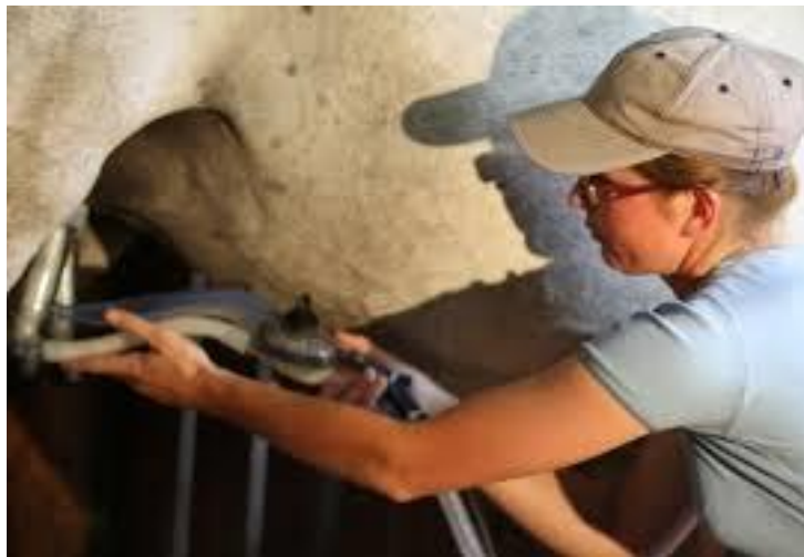
Slika 2. Strojna mužnja kobilu