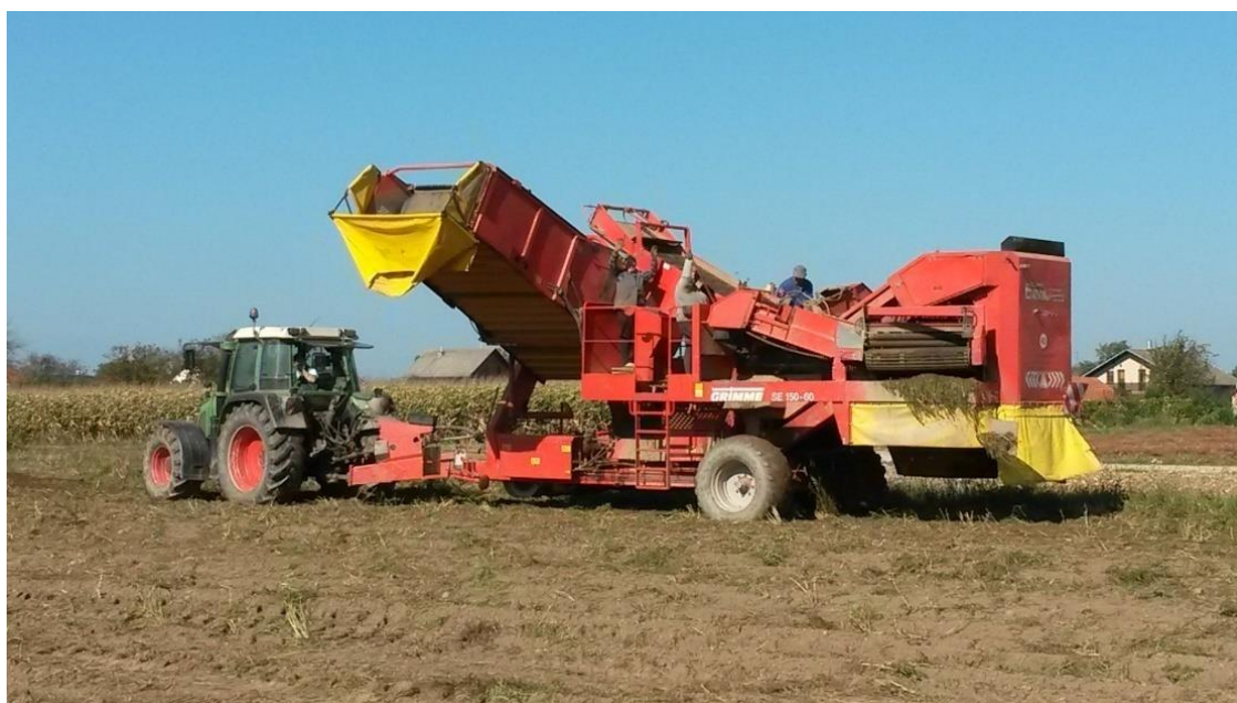
Slika 19. Dvoredni kombajn za vađenje krumpira vučen traktorom