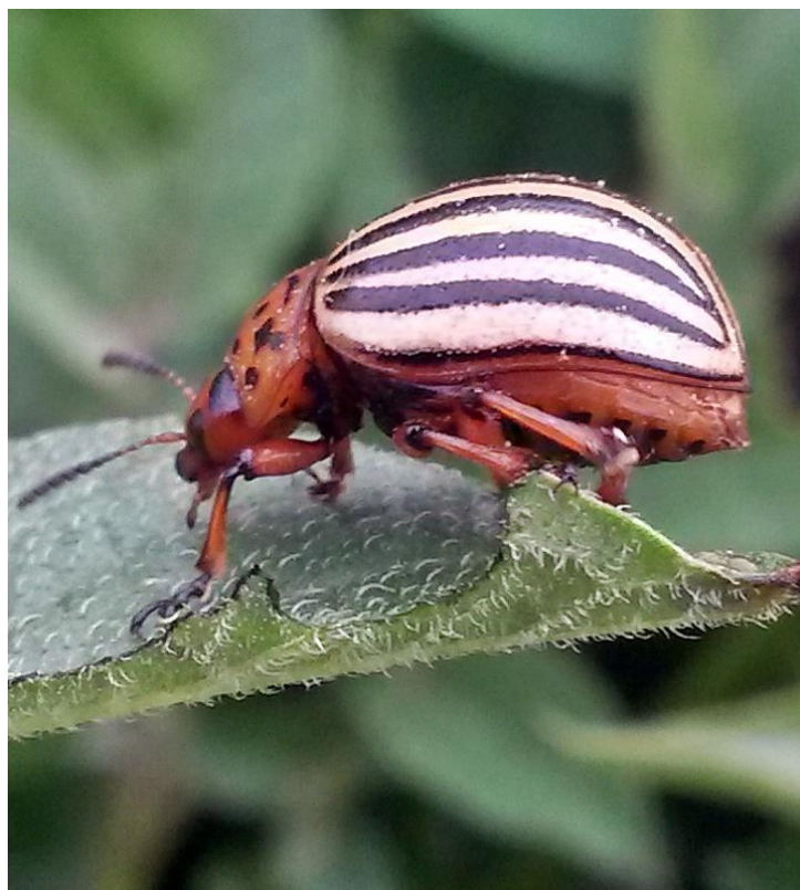
Slika 18. Imago krumpirove zlatice