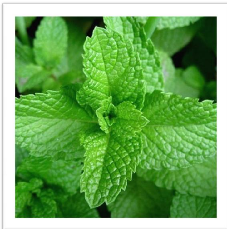
Slika 6. Listovi metvice