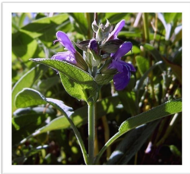
Slika 5. Cvijet kadulje