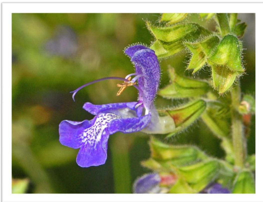
Slika 2. Građa cvijeta predstavnika porodice Lamiaceae

Porodica Lamiaceae je biljna porodica iz reda Lamiales (Štefanić, 2014.). Ime je dobila po vjenčiću koji je građen u obliku gornje i donje usne (Slika 2. ). Cvjetovi predstavnika ove porodice su dvospolni (ponekad poligamni) i monosimetrične građe.