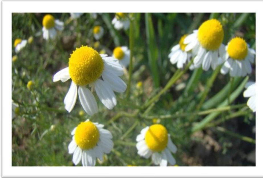
Slika 9. Prikaz cvati kamilice