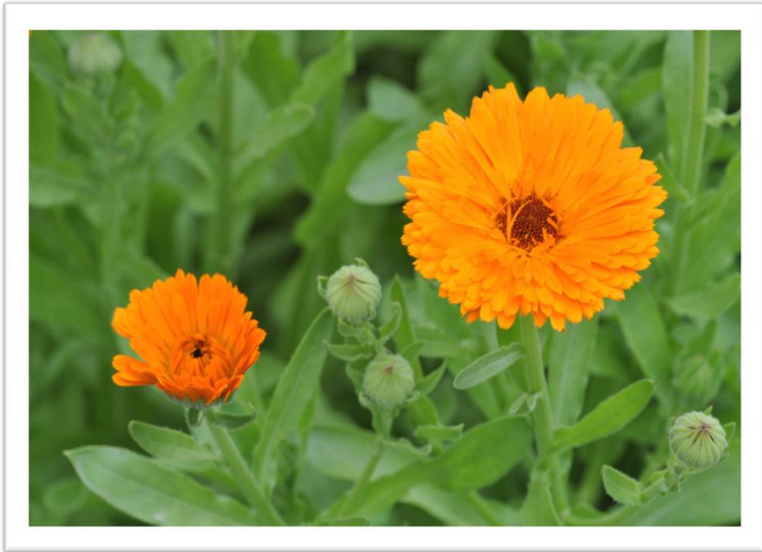
Slika 10. Cvat nevena