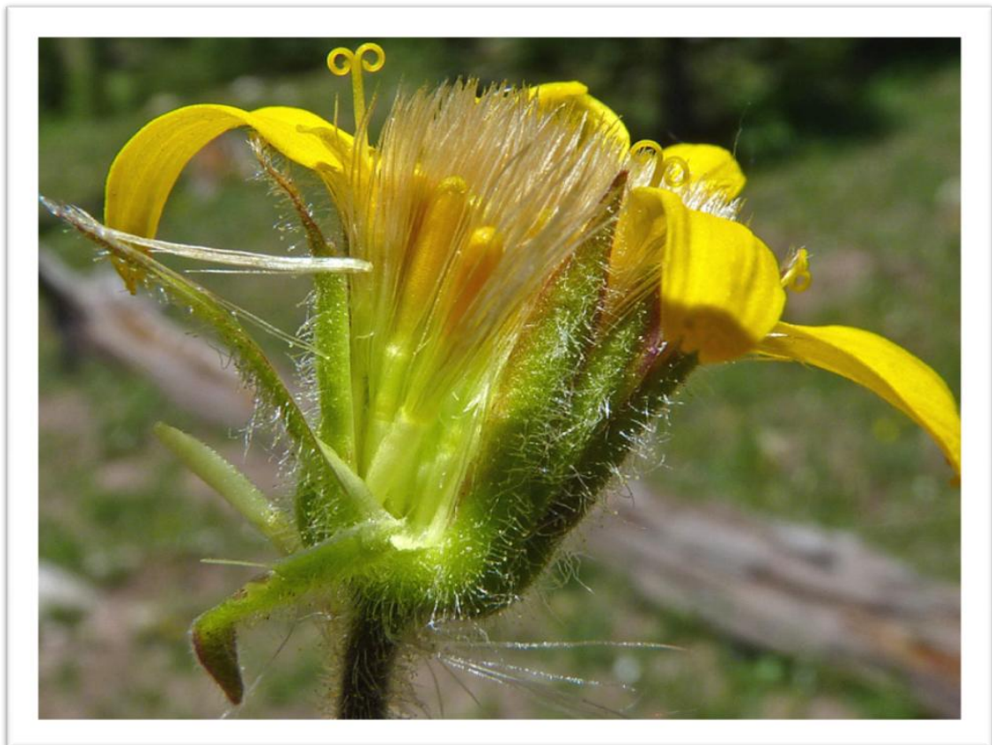
Slika 7. Jezičasti i cjevasti cvjetovi

Porodica obuhvaća više od 1600 rodova i oko 23 000 vrsta. Listovi su tipični dorziventralni ili bifacijalni i na stabljikama su smješteni naizmjenično. Pojedinačni cvjetovi su uglavnom složeni u glavičaste cvati. U glavičastim cvatima postoje dva tipa pojedinačnih cvjetova, to su: