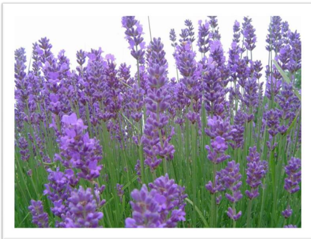
Slika 3. Lavandula angustifolia L.

Biljku obilježava jak, prepoznatljiv miris zbog bogatstva eteričnih ulja. Sadržaj eteričnih ulja je slijedeći: linalil acetat 40%, linalol 31.5%, beta-kariofilen 5.16%, terpinen-4-ol 4%, 1,8-cineol 0.69%, kamfor 0.3% te kumarini u tragovima. Eterično je ulje bezbojno i ima karakterističan, jak cvjetni miris.