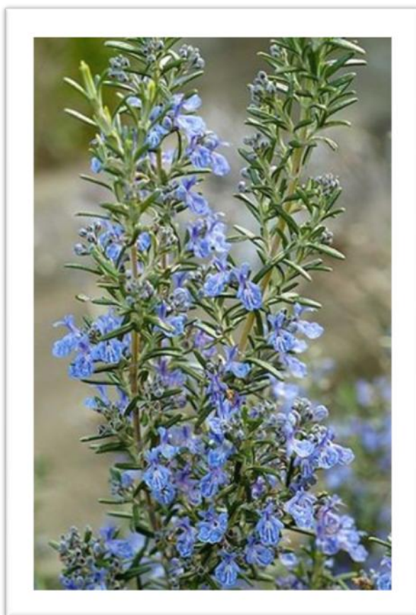
Slika 4. Prikaz cvjetova ružmarina

Ružmarin je vazdazelena grmolika biljka koja može narasti od 1 do 3 metra u visinu. Na odrvenjeloj stabljici se nalaze nasuprotno raspoređeni linearni listovi. Oni su sjedeći, čvrsti, kožasti podvinuta i cjelovita ruba, te prekriveni žljezdastim dlakama. (Slika 4). Cvjetovi se nalaze na maloj peteljci i smješteni su pršljenasto između ogranaka. Sitni su i ljubičastoplave boje. Cvatnja je od ožujka do svibnja, a ponekad i drugi puta u rujnu.