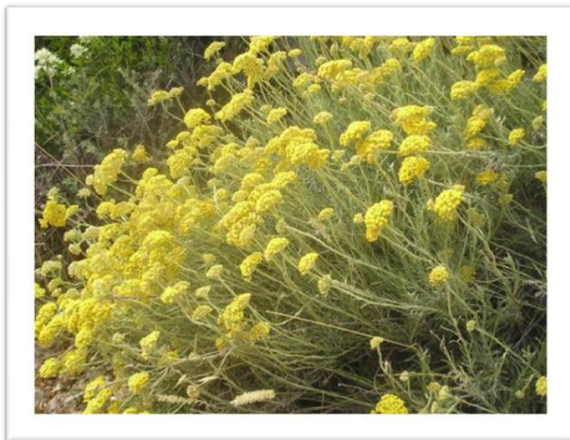
Slika 8. Helichrysum arenarium (L.) Moench- Smilje

Smilje je trajna zeljasta biljka sivkaste boje, obrasla vunanim dlakama (Slika 8.). Naraste do 60 cm visine. Stabljika je uspravna, ne razgranjena, i na njoj su na izmjenice raspoređeni listići čvrste kutikule, koji su s lica zeleni, a s naličja sivo zeleni, prekriveni sitnim dlačicama. Donji listići pri osnovi su skupljeni u rozetu.