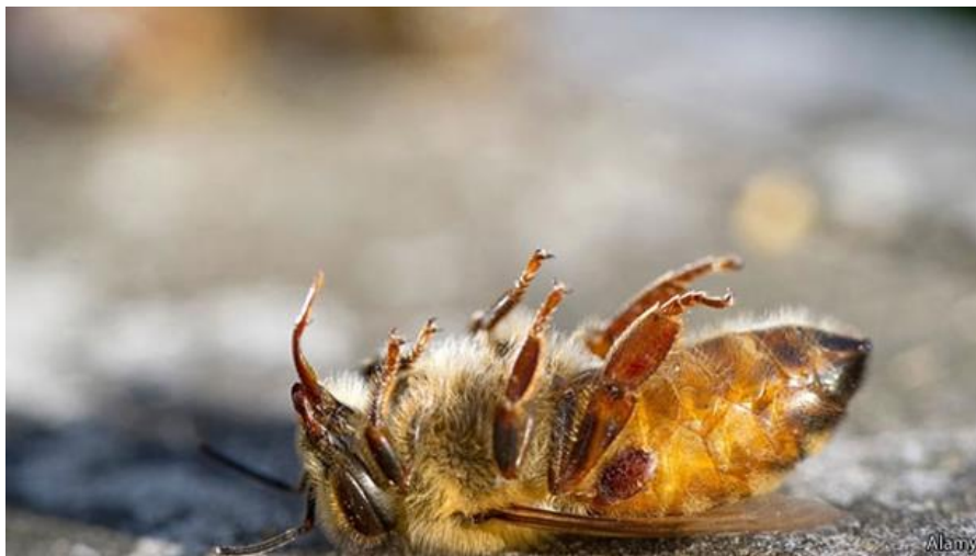
Slika 7. Uginula pčela