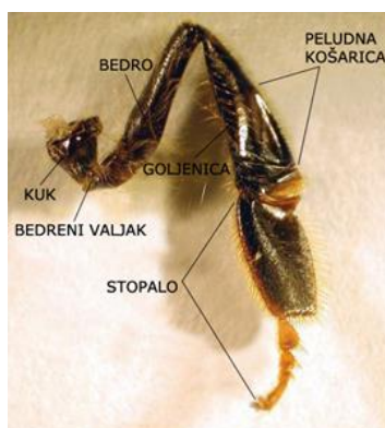
Slika 3. Građa stražnje noge

Srednje noge služe za čišćenje krila, četkanje peludi na peludnoj košarici i skidaju vosak iz voštanih džepića.