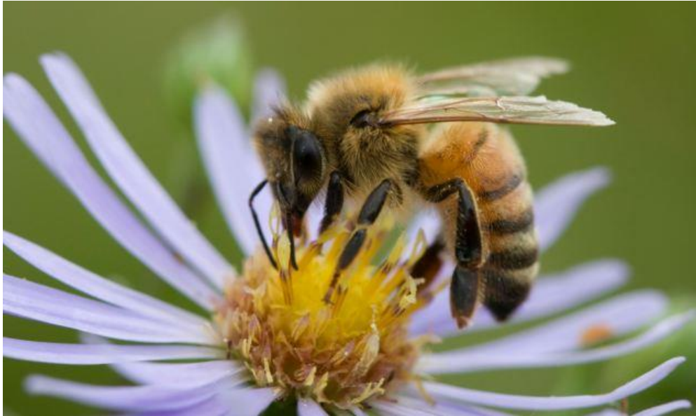
Slika 5: Pčela skuplja pelud

netretiranih pčela. Pogreške u uzorku plesa pčela sakupljačica rezultira pogrešnim usmjeravanjem skupljačica početnica pokazujući važnost plesa u usmjeravanju pčela sakupljačica prema izvorima nektarima. Slično, pčele su radile pogreške u udaljenosti do 6 sati koji ima utjecaj ne samo na neotrovane novake, koje su tražile hranu preblizu košnici, nego i na otrovane pčele koje nisu stigle do izvora.