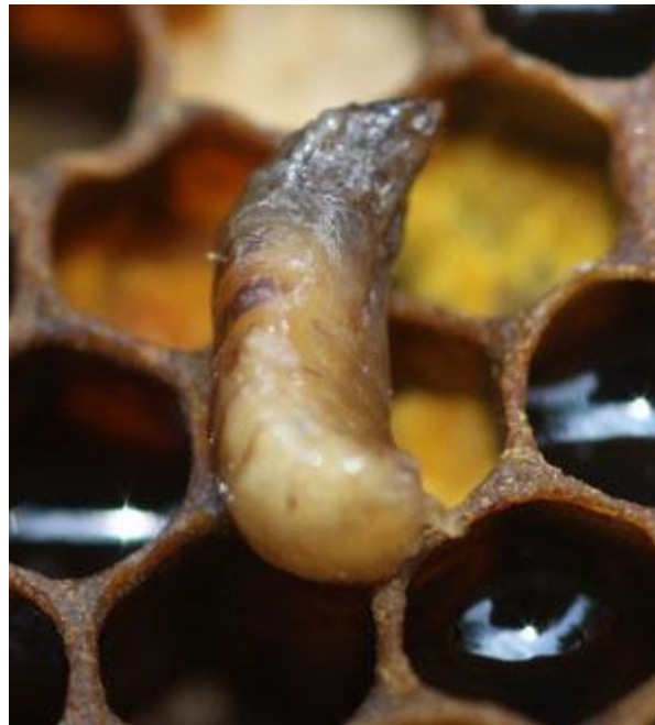
Slika 1. Mješiniasto leglo

Pojava mješiniastog legla smanji se u kasno proljeće kada počne intenzivan unos nektara, ali ako simptomi ustraju, preporuča se zamjena matice s mladom maticom.