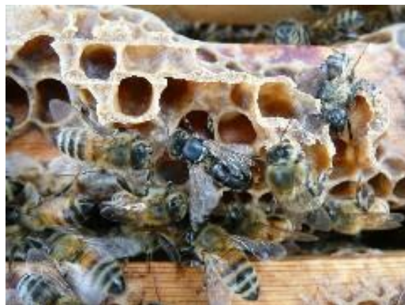
Slika 5. Crna pčela zaražena virusom akutne pčelinje paralize

Akutna pčelinja paraliza virusna je bolest mladih pčela radilica u pčelinjim zajednicama napadnutih grinjom Varroa destructor . Bolest nastupa u doba najjačeg razvoja pčelinjih zajednica. Nagla pojava bolesti tumači se aktiviranjem virusa prilikom uboda grinja koje sišu hemolimfu, što dovodi do naglog umnažanja virusa u hemolimfi, te dolazi do uginuća zaražene pčele.