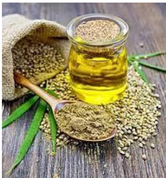
Slika 7.: Ulje od industrijske konoplje

Postoji još jedna velika blagodat primjene industrijske konoplje. To je ulje od industrijske konoplje koje može biti iznimno veliki potencijal.