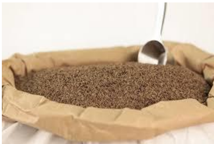
Slika 11. Kim pakiran u papirnatu vrećicu

U slučaju dvofazne žetve, pokošena masa bi trebala biti ostavljena 7 do 10 dana na polju prije žetve. Taj period je vrlo bitan budući da tada plodovi potpuno dozrijevaju. Toplo vrijeme pogoduje ovom procesu, međutim intenzivna insolacija nije pogodna. Taj način žetve je ponekad upitan jer se transportom suhih biljaka može smanjiti prinos (Hecht i sur., 1992.) zbog osipanja. Nakon žetve i mehaničkog čišćenja plodovi se trebaju osušiti na 10 – 12 % ukupne vlažnosti. Tada se plodovi trebaju držati u tankom sloju te redovno miješati u suhoj i prozračnoj prostoriji kako bi se postigla željena vlaga zrna. Sirovi materijal treba se pakirati u papirnate vreće, a ukoliko se neadekvatno skladišti, dolazi do propadanja zbog stvaranja plijesni i tako sjeme gubi vrijednost (Weglarz, 1992.) (Slika 11.). Plod koji će se koristiti kao začim treba se čuvati na suhim, hladnim i tamnim prostorima kako bi se što duže sačuvala aroma. Svježi plodovi koji se koriste za ekstrakciju ulja trebaju se odmah dopremiti do destilerije kako bi se dobilo što više eteričnog ulja (Malhotra, 2006.).