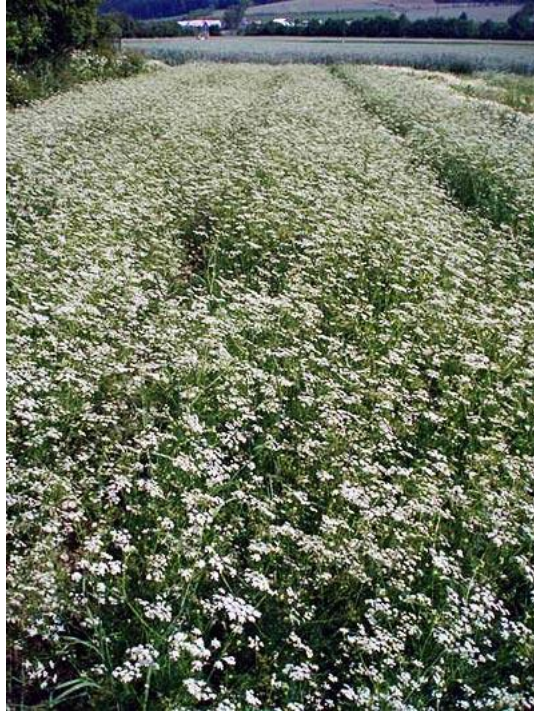
Slika 3. Polje kima