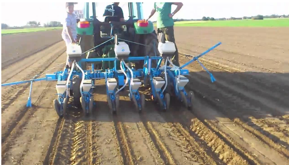
Slika 4. Sjetva kima

Kim se sije žitnom sijačicom, a spomenuti razmak ovisi radi li se o jednogodišnjem kimu ili dvogodišnjem kimu (Slika 4). Jednogodišnji kim sije se u redove na razmaku 20 – 24 cm i to isti broj sjemena na kvadratnom metru tla što zahtjeva nešto veće količine sjemena, točnije 12 – 15 kg sjemena/ha. Dvogodišnji kim sije se na širi međuredni razmak, kako bi mogao razviti veću stabljiku, čime se poboljšava kakvoća i povećava prinos ploda (Šilješ i sur., 1992.).