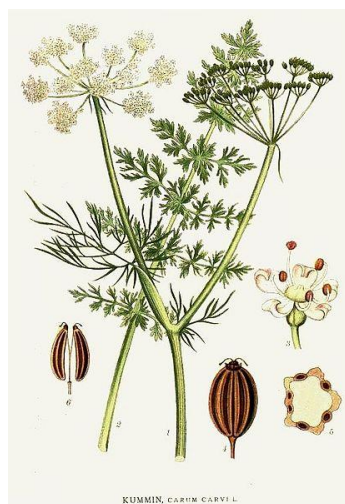
Slika 1. Kim ( Carum carvi L.)