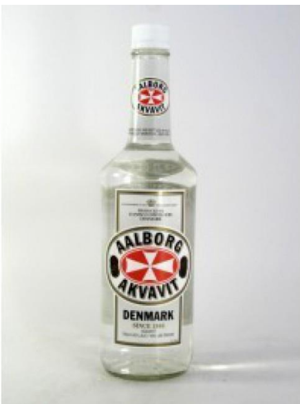
Slika 13. Skandinavsko alkoholno piće Akvavit