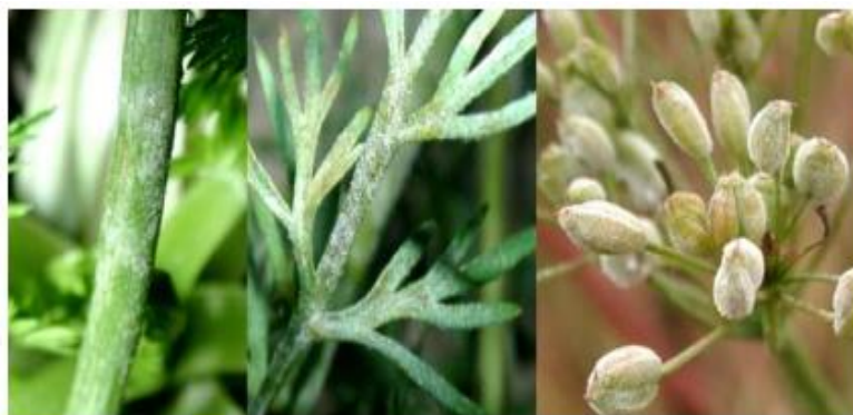
Slika 7. Pepelnica ( Erysiphe heraclei ) na nadzemnim dijelovima biljke kima