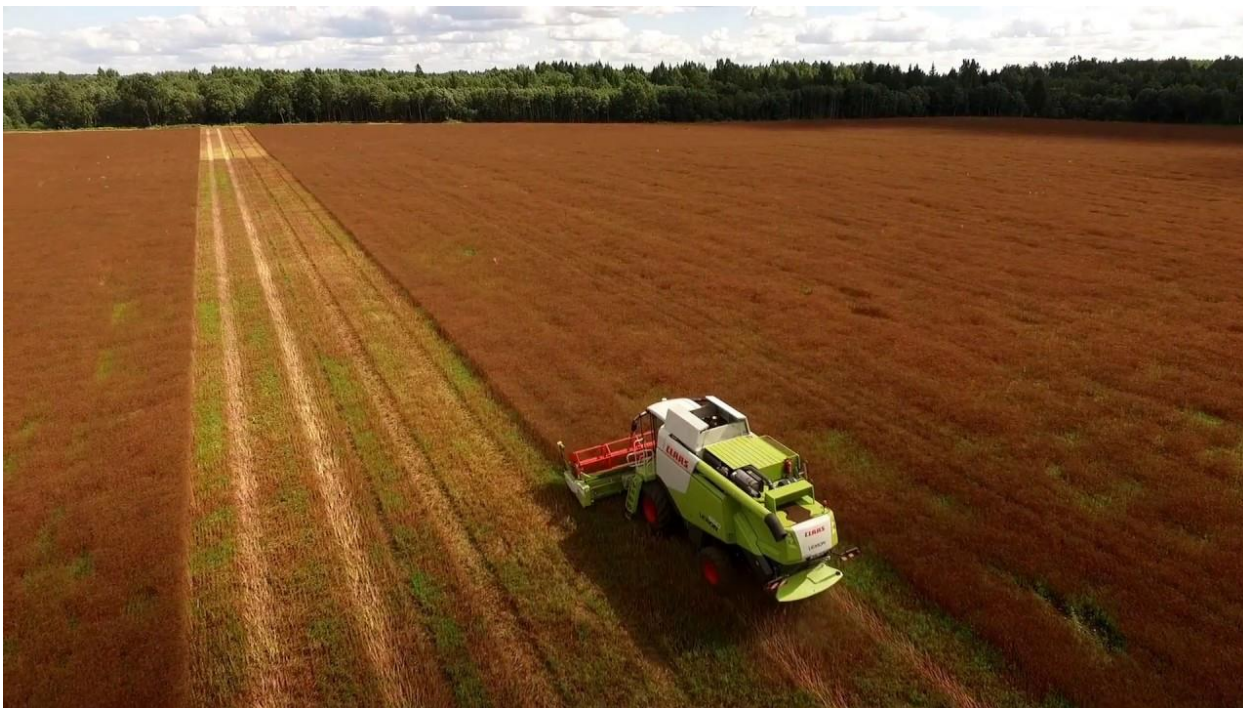
Slika 10. Žetva kima

Zbog osipanja plodova i sklonosti lomljenju, žetva treba biti provedena u pravo vrijeme. Najčešće se obavlja prijepodne ili predvečer, kada se zbog vlage u zraku sjeme manje osipa (Šilješ i sur., 1992.). Ovisno o regiji i sorti, dvogodišnji kim se žanje od srpnja do rujna, u Europi najčešće u kasnom lipnju ili prvoj polovici srpnja (Peter, 2006.). Ozimi kim je spreman za žetvu već u ožujku i travnju u uvjetima tropske klime, 4-5 mjeseci nakon sijanja. Međutim, u područjima umjerene klime jednogodišnji kim cvjeta nakon što prezimi tako da se žanje u srpnju, otprilike 15 mjeseci nakon sijanja. Žetva se obavlja kada sjeme poprimi karakterističnu tamnosmeđu boju budući da vrlo lako opada ukoliko se čeka da cijelo sjeme potpuno sazrije (web 5.). Žetva se obavlja kosilicom ili žitnim kombajnom te srpom na manjim farmama (Slika 10.).