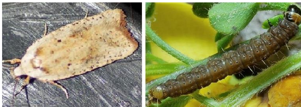
Slika 9. Imago i ličinka moljca kima ( Agonopterix nervosa )

Od štetnika, najopasniji je moljac kima ( Agonopterix nervosa ) (Slika 9.). Ličinka moljca napada stabljiku i list, a kasnije i cvat. Najpovoljnije vrijeme zaštite je treći stadij razvoja ličinke (s tim što tretman treba ponoviti nakon 8 do 10 dana) sa sredstvom na bazi tiakloprida .