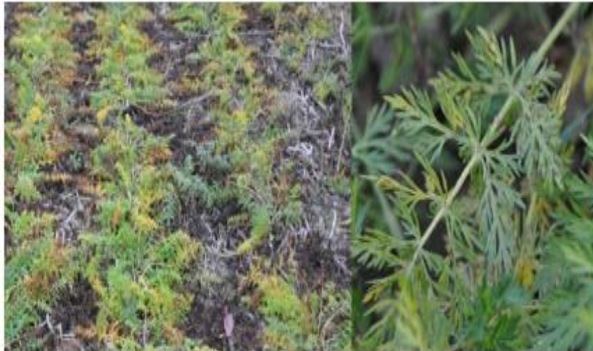
Slika 5. Pjegavost kima

Za visok prinos sjemena, vrlo je bitno održati adekvatnu vlažnost tla. Količina navodnjavanja ovisi o tipu tla i klimatskim uvjetima. Kod dvogodišnjeg kima prvo navodnjavanje treba biti pri razvoju stabljike, a drugo pri cvatnji i formiranju sjemena, odnosno u najbitnijim fazama za postizanje visokog prinosa sjemena. U semiaridnim područjima, gdje se uzgaja jednogodišnji kim, dvije faze u kojima je navodnjavanje najpotrebnije su rani razvoj kod nicanja te faza razvoja sjemena (Peter, 2006.).