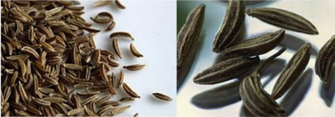
Slika 2. Plod kima (kalavac)