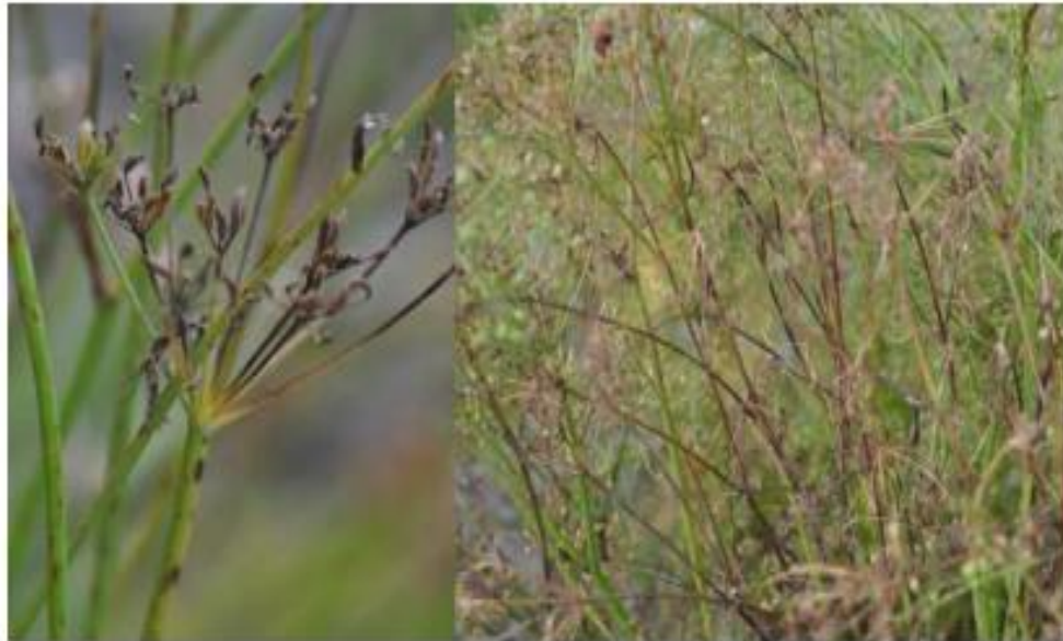
Slika 8. Simptomi uzrokovani gljivom Mycocentrospora acerina

Gljiva Mycocentrospora acerina uzrokuje antraknozu kima, simptomi su nekrotične pjege na podzemnim i nadzemnim dijelovima biljke (Slika 8.).