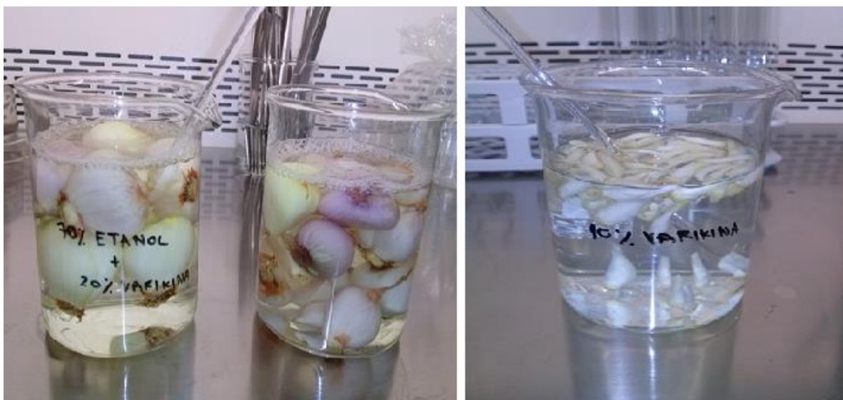
Slika 5. Dezinfekcija lukovica, izdvajanje i definfekcija eksplantata ljutike