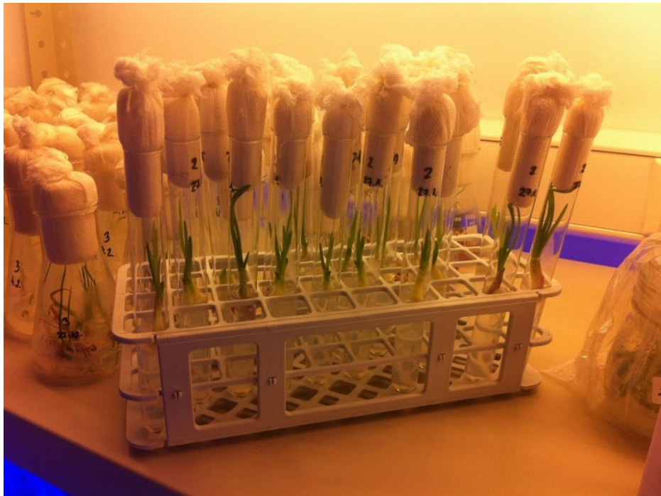
Slika 7. Eksplantati ljutike pod bijelim svjetlom (foto original; T. Kujundžić)

Rukovanje s eksplantatima prilikom uvođenja u kulturu provedeno je korištenjem sterilnog laboratorijskog pribora te se odvijalo u sterilnim uvjetima. Uvuđenje u kulturu se odvija na način da se pincetom svaki eksplantat uroni u hranjivu otopinu koja se nalazi u epruveti, bitno je plemenikom dezinficirati pincetu prilikom svakog novog eksplantata kako bi se smanjio postotak kontaminacije te se iz istog razloga na epruvetu stavlja i čep. (Slika 6, slika 7.).