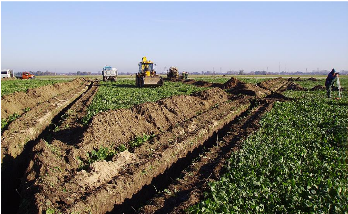
Slika 3. Postupak melioracije zemljišta

Cilj tog zakona bio je zaokruživanje seoskih gospodarstava u što jedinstveniji kompleks obzirom da je prethodno zbog rascjepkanosti seoskih gospodarstava došlo do slabijeg iskorištavanja određenih parcela. Doneseni zakon nije udovoljavao svim očekivanjima pa je 1902. usvojen novi zakon poznat kao Hrvatski zakon o komasaciji zemljišta prema kojem su se komasacije provodile narednih 50ak godina. Kasnije tijekom povijesti donosilo se još zakona o komasaciji, a sve s ciljem unapređenja poljoprivredne proizvodnje. Od osamostaljenja Republika Hrvatska nije pridavala veću pozornost komasaciji, a djelovanje geodetske struke bazira se uglavnom na sređivanju postojeće evidencije (internet) te državnoj katastarskoj izmjeri, koje za svrhu imaju, prije svega, „legalizaciju“ postojećeg stanja na terenu i rješavanje imovinsko-pravnih odnosa na obuhvaćenom području kroz zemljišnoknjižni ispravni postupak te izradu suvremenih (digitalnih) katastarskih planova. (Slika 4.)