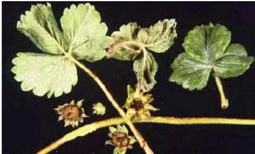
Slika 7. Simptomi napada jagodine grinje

Prema Maceljskom (1999.) najbolji načini zaštite od ovih grinja je preventivna mjera sadnje zdravih i nezaraženih sadnica. Biološka zaštita se provodi unošenjem korisnih grinja kao što su vrste iz porodice Phytoseidae . Predatorska grinja Neoseulus cucumeris vrlo je učinkovita u suzbijanju jaja i odraslih oblika grinje ako se unese u jagodnjak dok je grinja raširena u maloj populaciji (Petrović, 2012.). U Hrvatskoj ne postoje registrirana sredstva za zaštitu od jagodine grinje ( https://fis.mps.hr ).