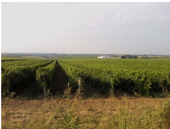
Slika 1. Vinogradi s pogledom na vinariju Vino Ilok d.d.

Nasad vinograda je u jednoj cjelini, uglavnom ravnog, blago nagnutog položaja. Posađeno je oko 4.300 čokota po ha u redove koji su dugi više stotina metara, a manipulativni putevi omogućuju normalan rad, okretanje i prilaz pojedinim dijelovima.