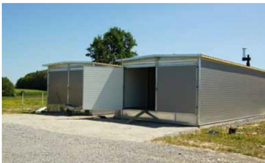
Slika 4. Suvremene sušare za ljekovito bilje