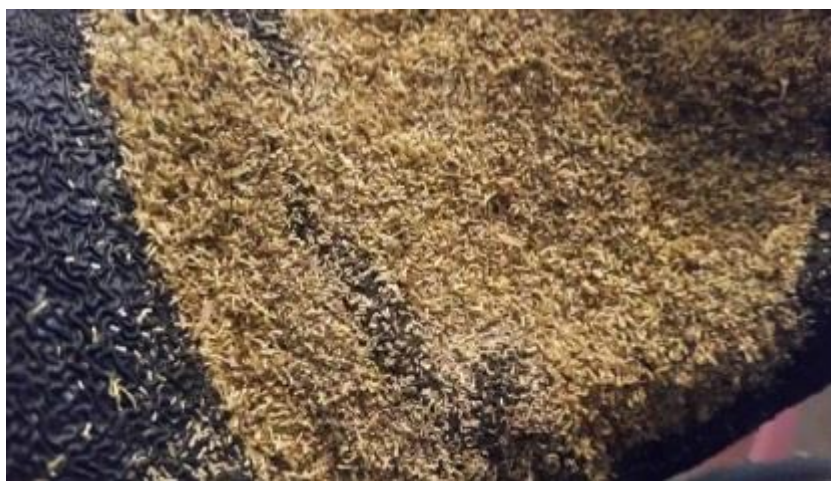
Slika 2. Sjeme kamilice

Pripremu tla za proizvodnju kamilice treba obaviti krajem kolovoza do sredine rujna. Nakon žetve pretkulture prvo se obavlja prašenje strništa kako bi se smanjio gubitak vlage i kako bi se potaknuo rast korova. Oranje se obavlja na dubinu do 25 centimetara, a može se i iskoristiti produženo djelovanje dubokog oranja pretkulture, pa umjesto oranja obaviti tanjuranje na 10 do 20 centimetara dubine. Oranje ili tanjuranje omogućuje kasnije ukorjenjivanje kamilici, te uništava iznikle korove mehaničkom mjerom koja se smatra zdravijom od kemijske (herbicidima). Zatvaranje brazde i priprema sjetvenog sloja obavlja se odmah nakon oranja kako se zemlja ne bi isušila i zgrudala. Prije sjetve treba izvaljati površinu u dva do tri prohoda, ovisno o tipu i strukturi tla, dok se ne dobije ravna i zbijena površina (savjetodavna.hr 2017.).