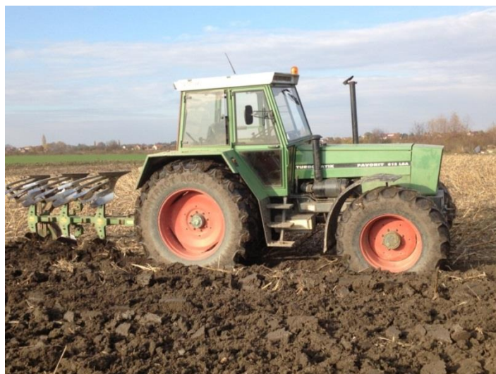
Slika 1. Oranje plugom "Eberhardt"

Na OPG-u Branimir Subotić suncokret je bio zasijan na različitim parcelama s različitim predusjevima i različitom osnovnom i dopunskom obradom tla. Tako je, na parceli na kojoj je bila predkultura kukuruz, nakon žetve obavljeno malčiranje žetvenih ostataka malčermom "IMT-618.058" zahvata 210cm. Nakon toga pristupilo se dubokom oranju u 11. mjesecu na dubinu 30-35 cm, plugom premetnjak proizvođača "Eberhardt" koji ima 3 brazde s rešetkastim daskama koje uvelike pomažu usitnjavanju i boljem slaganju brazdi (Slika 1.).