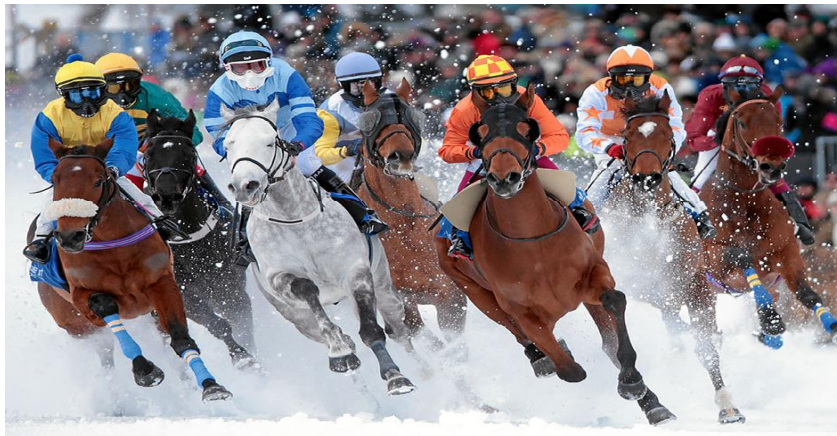
Slika 3. Galopske utrke na snijegu

Održavaju se u nekim sjevernijim zemljama (Finska, Švedska, Norveška) gdje služe kao dopuna redovnom ispitivanju konja u utrkama. (Flander, 1975.) Na njima se utrkuju engleski punokrvnjaci u starosti 3 do 10 godina održavaju se na hipodromima ili na stazama pripremljenim u tu svrhu. Pravila i uvjeti za utrke su isti kao i kod ravnih galopskih utrka, najčešće ih jašu profesionalni jahači, ali postoje i utrke za amatere. Glop na snijegu znatno je teži jer snijeg umanjuje brzinu, i zahtjeva od konja puno veći napor i odličnu fizičku kondiciju. Postignuto vrijeme u ovim utrkama je znatno manje nego u onima na travnatim ili pješčanim stazama iste dužine. Da bi se izbjeglo klizanje konja i spriječilo skupljanje snježnih naslaga, konji se potkivaju s posebnim potkovama. Oprema konja i jahača je jednaka kao i u ostalim galopskim utrkama. (Slika 3.)