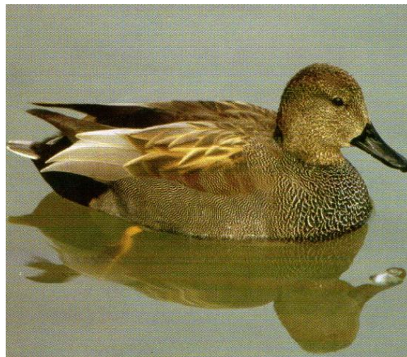
Slika 10. Patka kreketaljka (Mustapić, 2004.)

Patka kreketaljka ( Anas strepera ) je ugrožena gnjezdarica i nije lovna divljač. Obitava na otvorenim stajaćim ili sporotekućim eutrofnim (bogatim organskom produkcijom) nizinskim vodama s bogatom obalnom vegetacijom (trska, rogoz). Mužjak je prepoznatljiv po pretežito jednoličnom sivom ruhu s kestenjastim krilnim pokrovnim perima i crnim nadrepkom i podrepkom. Ženka slični ženki divlje patke (gluhare), ali je manja, sivkastija, s kraćim i sitnijim kljunom. U letu se ističe bijeli trbuh (u gluhare je smeđ) i crno-bijelo zrcalo (u gluhare plavo). Nešto su manje od gluhara, teže od 0,5 do 1,1 kilograma. Mlade su ptice slične ženkama, ali su pera na leđima i bokovima riđe obrubljena. Najduži životni vijek zabilježen u prirodi jest 13 godina (Mustapić, 2004.).