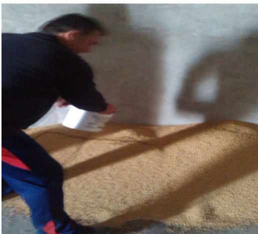
Slika 8. Nanošenje bakterija na soju prije sjetve

Bakterizaciju sjemena soje prije sjetve bakterijama Bradyrhizobium japonicum spp. Treba smatrati obaveznom i učinkovitom mjerom u tehnologiji proizvodnje soje. Posebno je značajna na tlima gdje ranije nije uzgajana soja ili nije sijana duže razdoblje. Unošenjem bakterija fiksatora dušika u tlo popravlja mu se struktura. Povećava se sadržaja bjelančevina u zrnju soje, štede se dušična gnojiva za slijedeću kulturu.