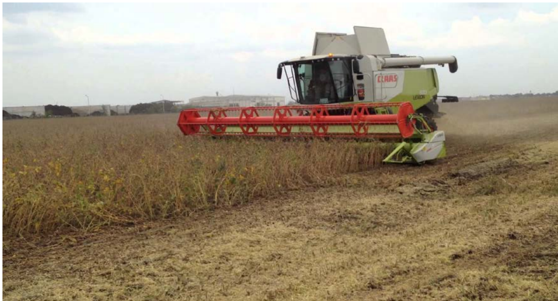
Slika 9. Žetva soje

Važna je dobra poravnatost tla i visina prve donje mahune. Optimalna žetvena vlažnost zrna soje je između 14 i 16%, ali bilo bih poželjno da bude ispod 13% da se izbjegnu troškovi sušenja.