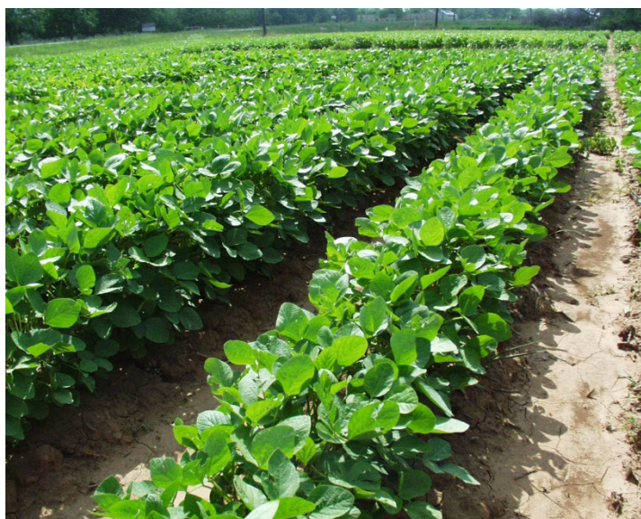
Slika 2. Soja koja ima dovoljno vlage

Velike količine oborina u cvatnji dovode do opadanja velikog broja cvjetova. IZREKA: “ako su mahune mokre, a cvjetovi suhi, dobri su prinosi“.