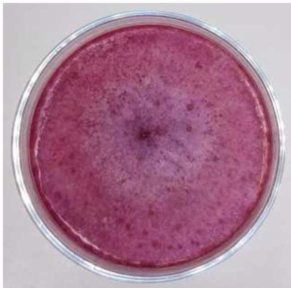
Slika 3. Fusarium culmorum (original)

Fusarium culmorum je gljiva koja je u stanju izazvati trulež korijena i donjeg dijela stabljike, te fuzarijsku palež klasa na različitim žitaricama malog zrna, a posebice na pšenici i ječmu. To uzrokuje značajne gubitke kvalitete i prinosa i rezultira zagađenost žitarica mikotoksinima (Scherf i sur., 2013).