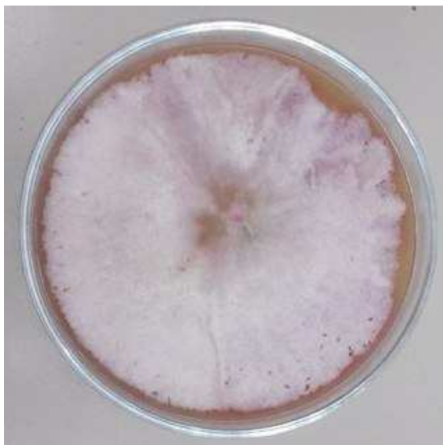
Slika 1. Fusarium solani (original)

Na PDA podlozi F. solani proizvodi dobro razvijen bijeli micelij. F. solani proizvodi nespolne mikrokonidije i makrokonidije. Kolonije ove gljive brzo rastu, promjenjive su boje, često su granulirane ili paučinaste, crveno-rozne boje ili boje lavande, ali mogu biti i bijele (Luginbuhl, 2010.).