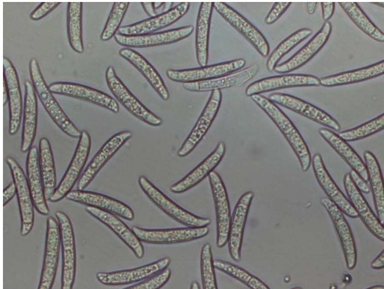
Slika 2. Makrokonidije F. solani (Poštić, 2012.)

Hlamidospore formira brzo i u velikom broju na CLA podlozi (podloga sa karanfilom). Veličina hlamidospora se kreće od 9,3 do 12,2 \mu\text{m} .