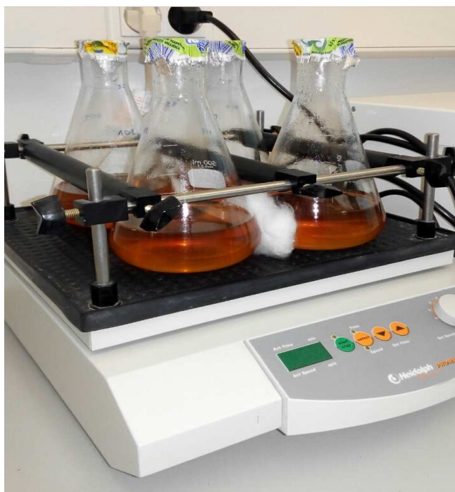
Slika 5. Horizontalna treskalica s tekućom podlogom (original)

U dobivenoj suspenziji potrebno je 2 sata natapati sterilna zrna pšenice, te se nakon toga stavljaju na vlažan filter papir u Petrijeve zdjelice. Nakon 3 dana zrna je potrebno natapati sat vremena u suspenziji F. culmorum . Ova se suspenzija dobije tako da se F. culmorum uzgaja na PDA podlozi 7 dana, te se nakon toga micelij sastruže i samelje sa 40 ml vode. Nakon toga zrna se stavljaju na vlažan filter papir u Petrijeve zdjelice promjera 150 mm, a nakon 7 dana se mjeri dužina klica i simptomi bolesti.