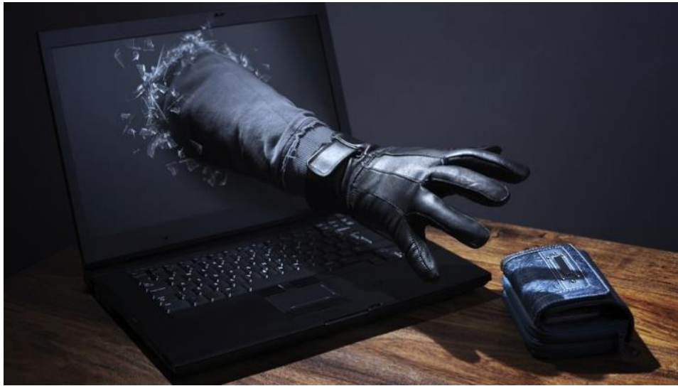
Slika 1.: Internet krađa